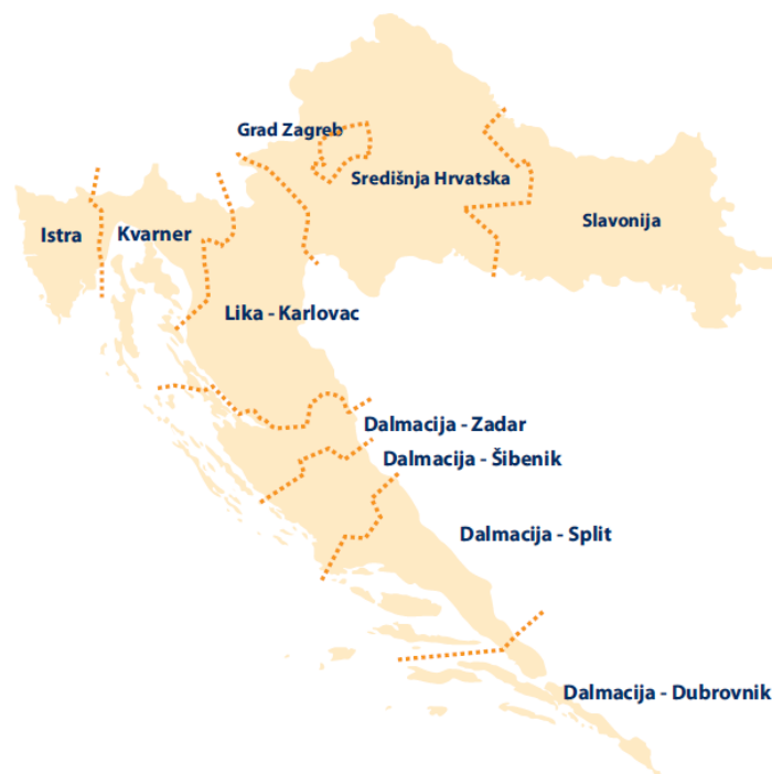
Slika 5: Prikaz 10 turističkih regija