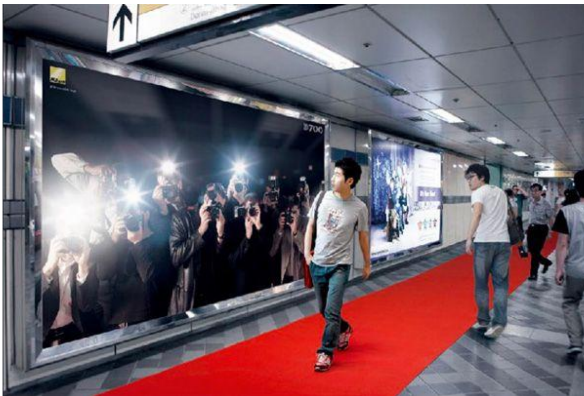
Slika 1. Kampanja za Nikon