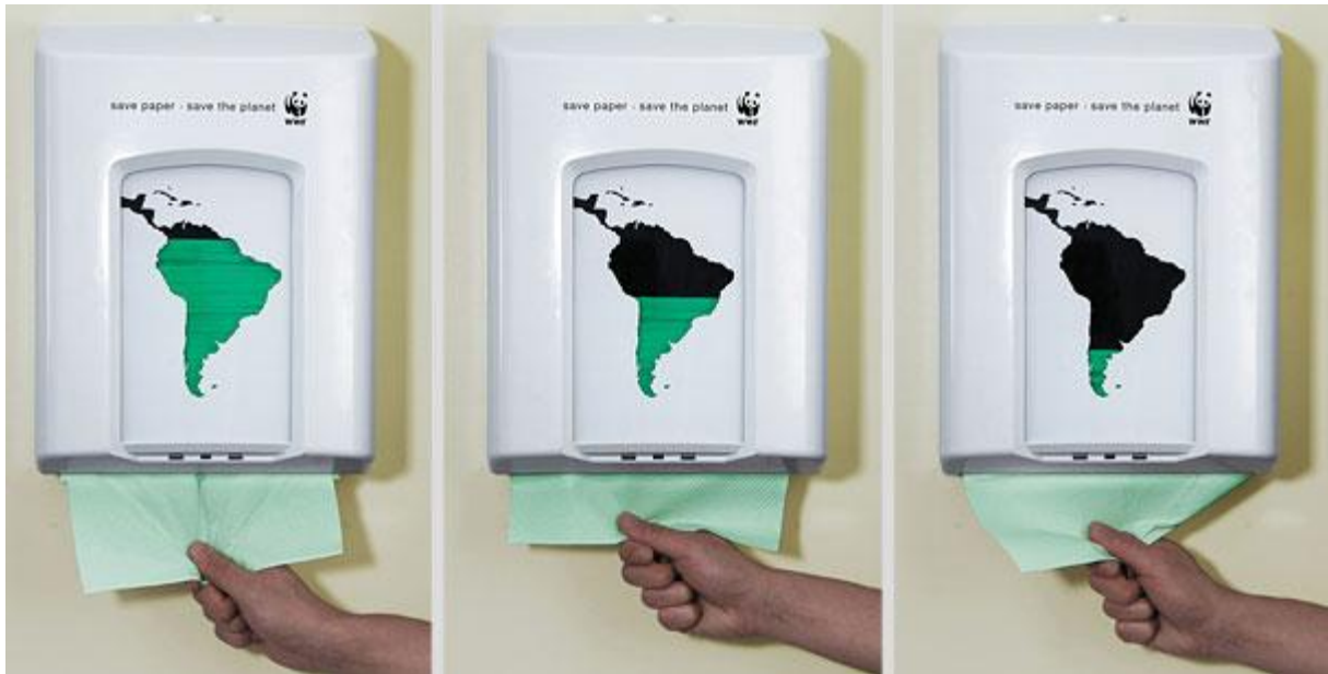
Slika 6. WWF-ova kampanja za očuvanje prašuma