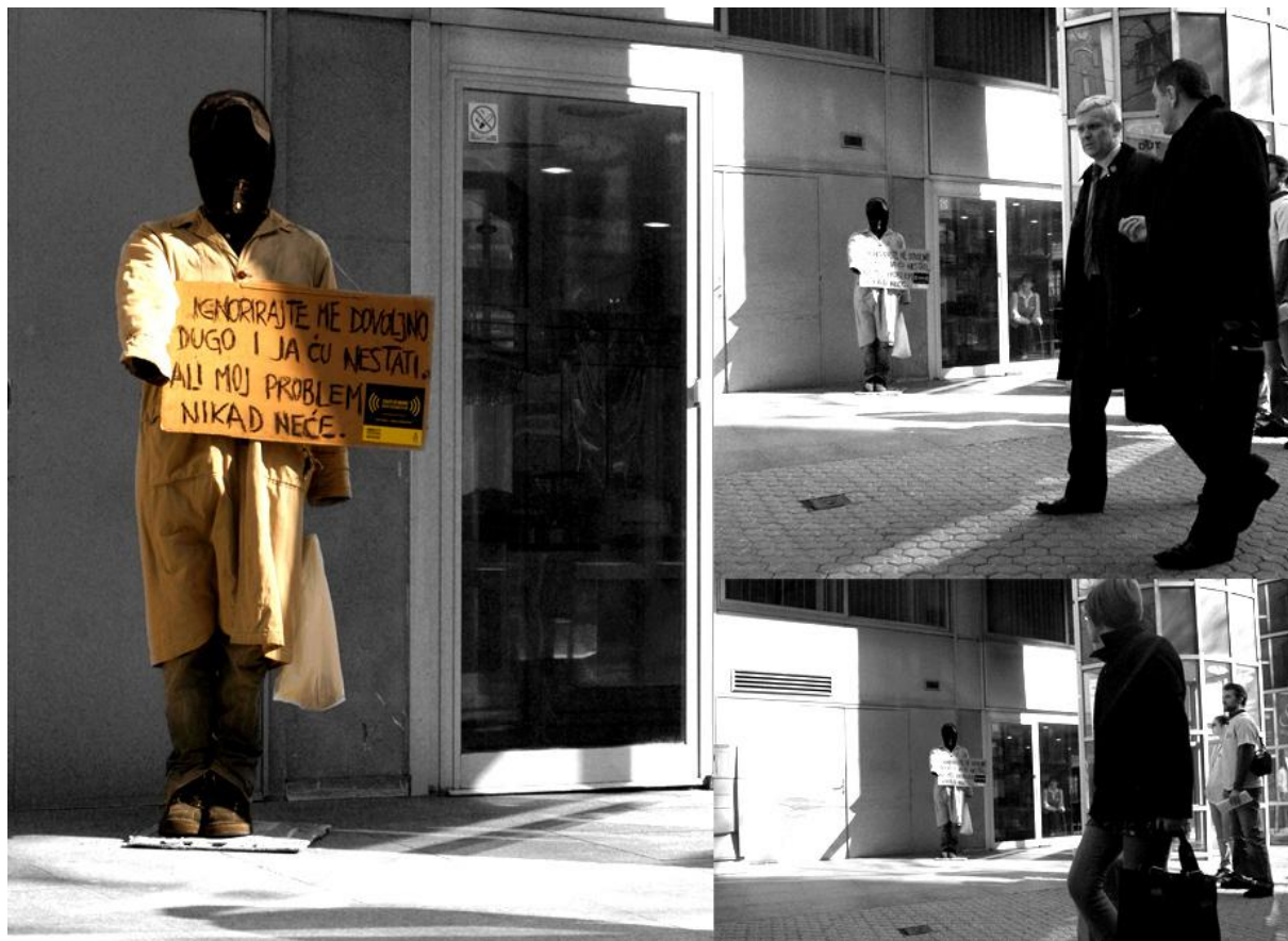
Slika 12. Zahtjevamo dostojanstvo

postavljene su lutke kojima su htjeli privući pozornost građana, zakonodavca i lokalne samouprave te ih motivirati na rješavanje tog društvenog problema.