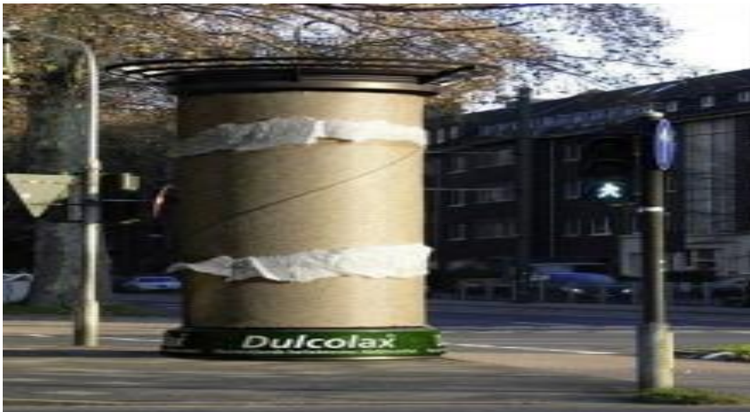
Slika 2. Tvrtka Dulcolax- prodaja laksativa

Dvije karakteristike gerilskog marketinga pobuđuju efekt niskih troškova. Prva je rasprostranjenost, koja dolazi do velikog broja ljudi. Drugo, gerilske kampanje su često puštene u promet bez mnogo početnih novčanih izdataka. Čak i kada početni troškovi kampanje zahtijevaju veće novčane izdatke, efekt rasprostranjenosti osigurava dolazak kampanje do široke mase. Primjer niskih troškova, a uspješne kampanje je njemačka tvrtka Dulcolax, koja se bavi prodajom laksativa. Ideja kampanje bila je postaviti na određene lokacije ogromne role potrošenog wc-papira, koje šalju poruku o djelotvornosti laksativa.