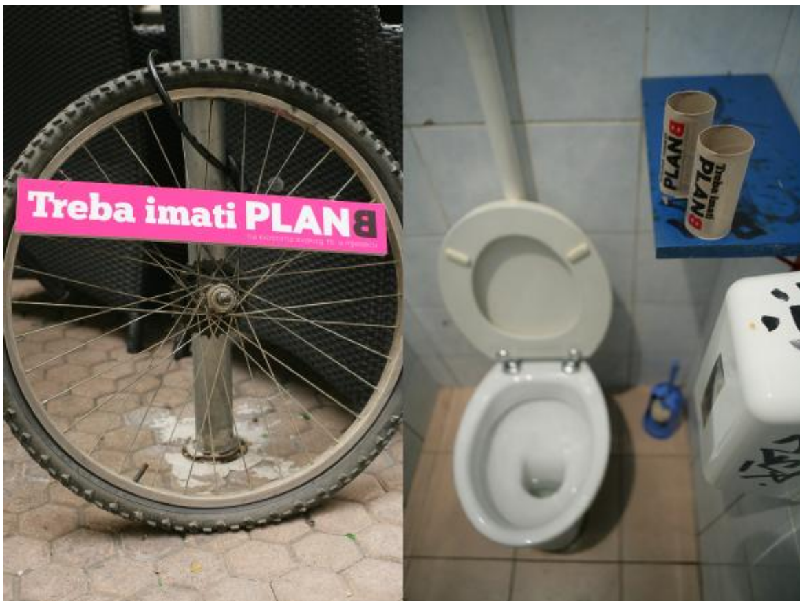
Slika 11. Kampanja- treba imati plan b

4. Sljedeći primjer (što je zaista oksimorn u ovom kontekstu) jest kampanja pod nazivom ‘Treba imati Plan B’ za časopis Plan B, koji u se u trenutku kampanje tek trebao pojaviti na kioscima. Radi se o konceptu sa dva odlična scenarija. U prvom imamo kotač bicikla vezan za stalak za parkiranje bicikala, na kojem se nalazi tabla s natpisom “Treba imati plan B – na kioscima svakog 15. u mjesecu”. Drugi scenarij su obični prazne role WC papira, postavljene u javnim WC-ima, na kojima piše ista stvar. Već nakon samog pogleda kotač i WC-papir, sve vam je jasno: čekam petnaesti i odlazim do kioska po svoj primjerak 8 .