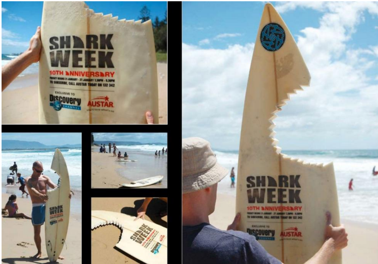
Slika 5. Daske za surfanje AUSTAR'S Discovery Channel-a