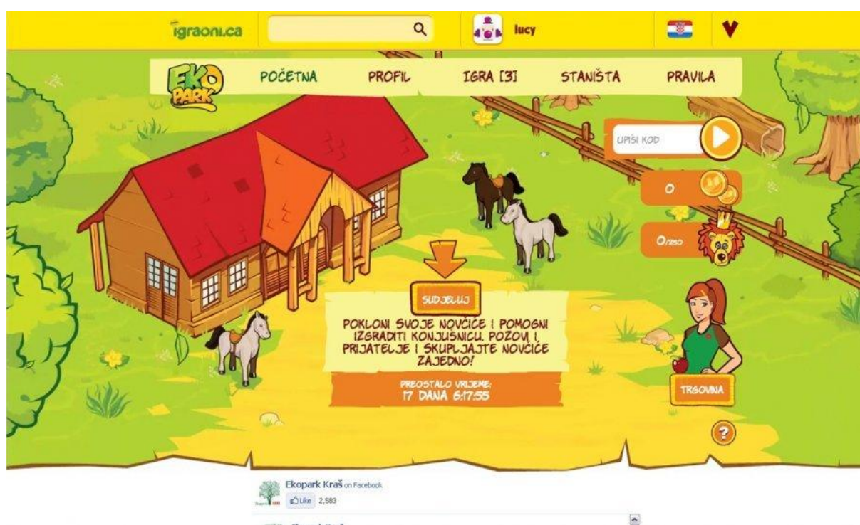
Slika 10. Kraš- Životinjsko carstvo

marketinškim potezom Kraš se još više približio svojim potrošačima i njegovi brandovi postali su mediji za društvenu interakciju među prijateljima. Zabavna igra sakupljanja i razmjene sličica Životinjsko carstvo, razvijena u suradnji s agencijom DRAP, postigla je spektakularan uspjeh o kojem najbolje svjedoče brojke: više od 76 milijuna učitanih stranica, 63 milijuna društvenih interakcija kroz ponudu i razmjenu sličica, 87.000 potpunjenih albuma. Popularnost igre u regiji odrazila se i na prodaju čokoladica koja je porasla za 31,7% u 2008. i 38,9% u 2009. u odnosu na referentnu 2007. godinu, pri čemu je najveći rast prodaje ostvaren je u periodu najvećeg prometa na igri. Projekt je nagrađen je Effie zlatom u kategoriji niskobudžetnih kampanja. 7