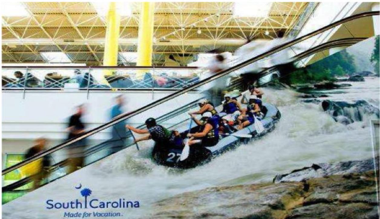
Slika 8. Turizam u Južnoj Karolini