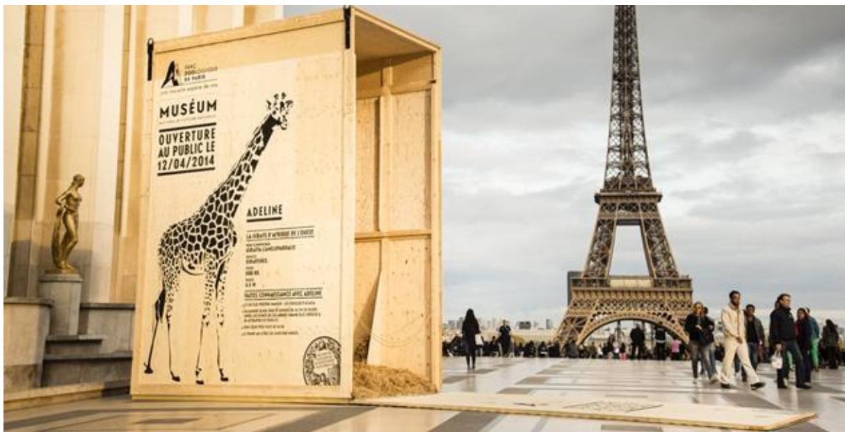
Slika 4. Zoo u Parizu

2. Drugi odličan primjer nalazi se u Parizu. Netom poslije otvorenja pariškog zoološkog vrta, na Trocaderu je postavljen otvoren kavez za životinje, konkretno žirafe, kako bi se stvorilo uzbuđenje i privuklo turiste da dođu u zoološki vrt budući da izgleda da je životinja pobjegla iz kaveza prema Eiffelovom tornju 6 .