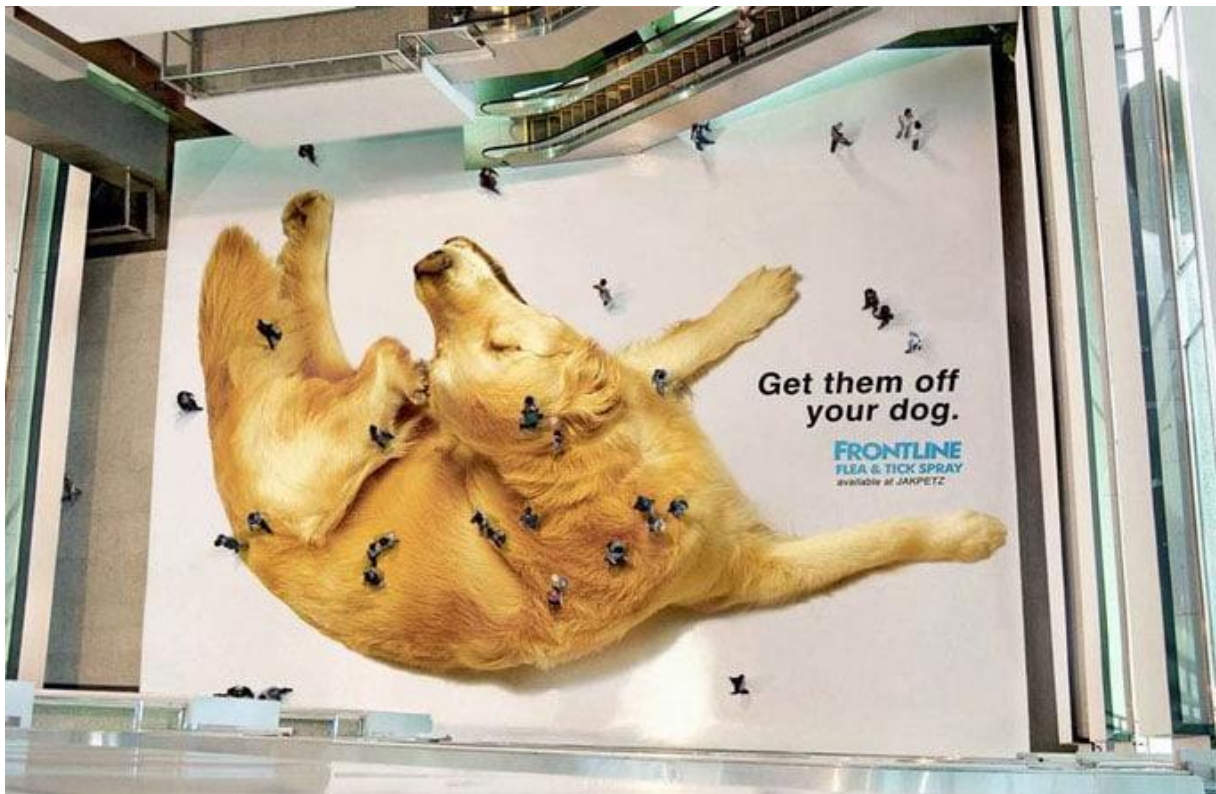
Slika 7. Kampanja tvrtke Frontline