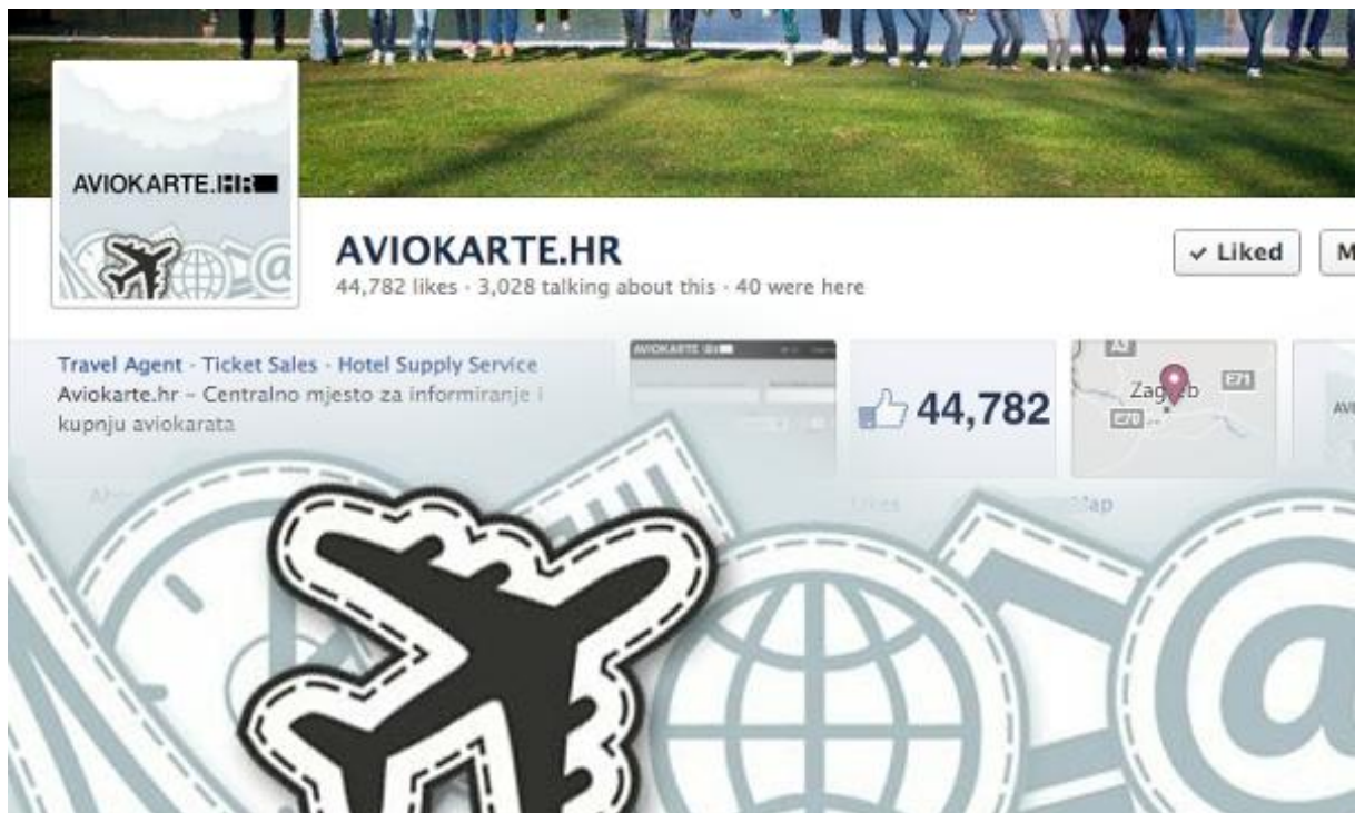
Slika 9. Aviokarte. Hr