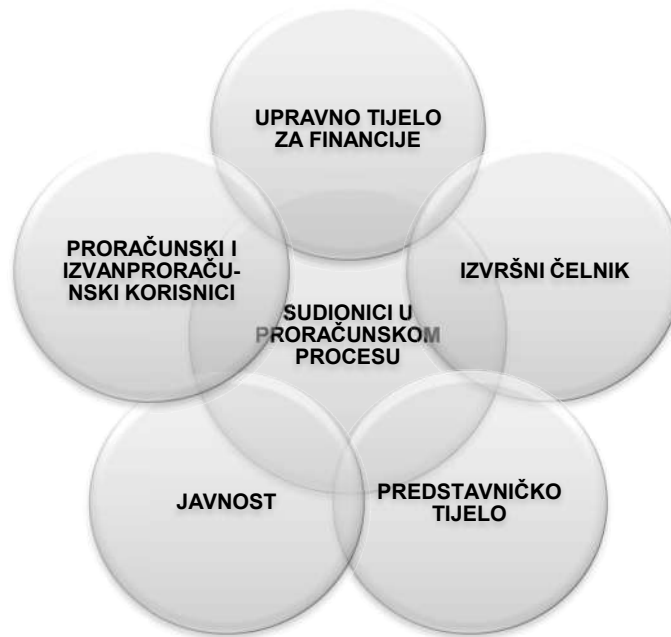
Slika 1. Sudionici u proračunskom procesu

gradu je to gradonačelnik. U prijedlogu proračuna predlaže sredstva za proračunsku zalihu koja se mogu koristiti za nepredviđene namjene, za koje u proračunu nisu osigurana sredstva ili za namjene za koje se tijekom godine pokaže da za njih nisu utvrđena dovoljna sredstva jer ih pri planiranju proračuna nije bilo moguće predvidjeti.