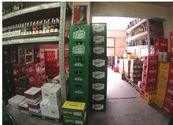
Slika 9: Unutrašnji dio skladišta

Unutar skladišta se nalaze materijali potrebni za prodaju i gotovi proizvodi, odnosno alkoholna i bezalkoholna pića. Dio robe je smješten po policama metalne strukture, s drvenim plohamama. Ostatak robe je upakiran u transportnu ambalažu i smješten na paletama ili na podu, ako su u pitanju pive. Prilikom raspoređivanja robe po skladištu, skladištari se drže određenih pravila. S obzirom da je dio pića upakiran u staklene ambalaže, izrazito je važno da se roba smješta po skladištu sa pažnjom i oprezom kako ne bi došlo do lomova. Roba koja se češće izdaje iz skladišta, smješta se što bliže ulazu u skladište kako bi se olakšao posao i smanjilo vrijeme potrebno za izdavanje robe. Roba koja se rjeđe prodaje se smješta prema stražnjem dijelu skladišta. Kod slaganja robe na police, važno je da se na police koje su nadohvat ruke slaže roba koja se češće izdaje iz skladišta, a na visoke police se slaže roba koja se rjeđe izdaje. Ispod svake robe se nalazi priložena deklaracija koja sadrži naziv proizvoda, bar-kod, te cijenu. Također, radnici svakih deset do petnaest dana provjeravaju rokove na proizvodima kako bi bili sigurni da je roba ispravna. To svakako utječe na kvalitetu usluge jer su onda sigurni da se neće kupcu greškom dostaviti roba kojoj je istekao rok. Skladištari robu koja je lakše težine mogu raspoređivati i slagati na police rukama. Kad se radi o težoj robi i većim količinama, djelatnici se koriste viličarima koji im olakšavaju posao skladištenja robe.