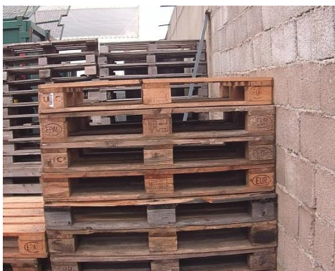
Slika 11: Euro palete

U ovom prodajno-distribucijskom centru se koriste euro i industrijske palete. Obje vrste paleta koje se koriste su dimenzija 800x1200 mm. To su ravne palete izrađene od drveta i namijenjene za višekratnu upotrebu. Palete olakšavaju rukovanje robom i njeno premještanje do transportnog vozila. Djelatnici u ovom centru premještaju palete s robom pomoću viličara. Viličar je vozilo koje služi za dizanje i spuštanje paleta, a koristi se tako da vilice ovog vozila prođu ispod paleta i zatim je podignu kako bi paletu prenijelo do potrebnog mjesta. Kad se roba dostavi kupcu, kupac mora prodajno-distribucijskom centru vratiti palete. Ba-com također vraća palete dobavljačima nakon što se zaprimi roba, jer u suprotnom dobavljač financijski zaduži Ba-com za te palete.