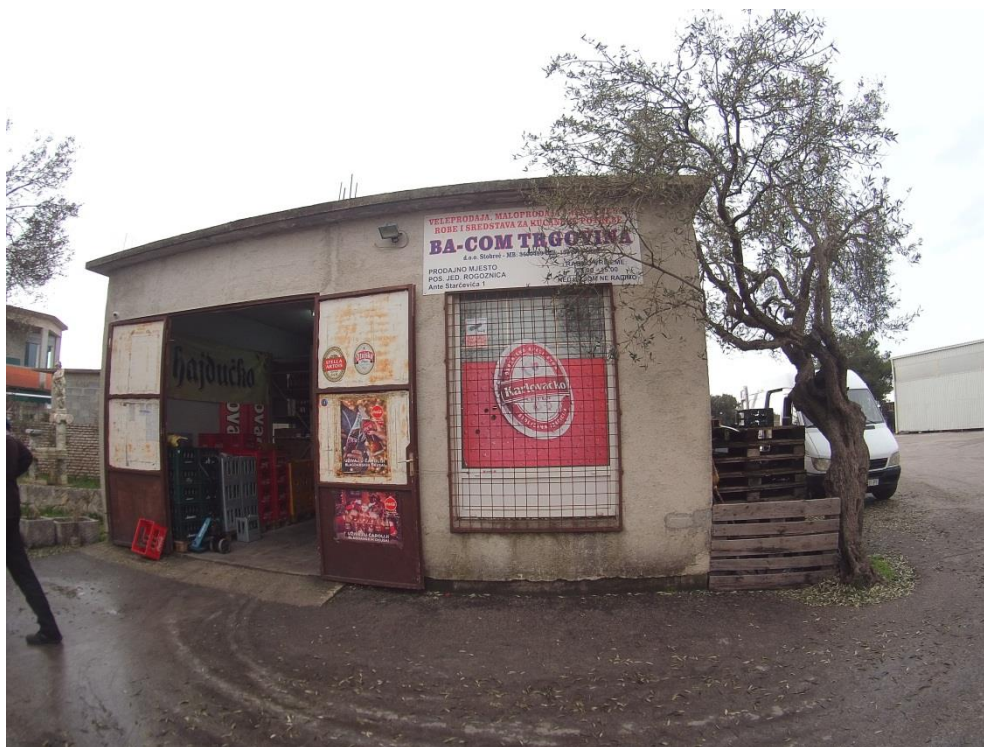
Slika 7: Ba-com prodajno-distribucijski centar u Rogoznici

U centru radi petero stalnih zaposlenika, a taj broj se za vrijeme sezone povećava na petnaest djelatnika. U voznom parku preko godine imaju dva kombija i jedan Caddy, a za vrijeme sezone četiri kombija i dva Caddyja.