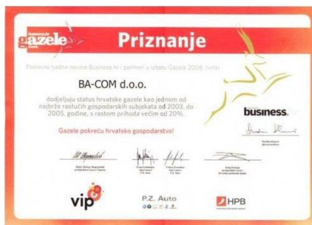
Slika 5: Priznanje hrvatske gazele

Ba-com je 2006. godine dobio status hrvatske gazele kao jedno od najbrže rastućih gospodarskih subjekata od 2003. do 2005. godine, s rastom prihoda većim od 20%. 39