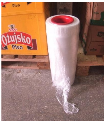
Slika 10: Stretch folija