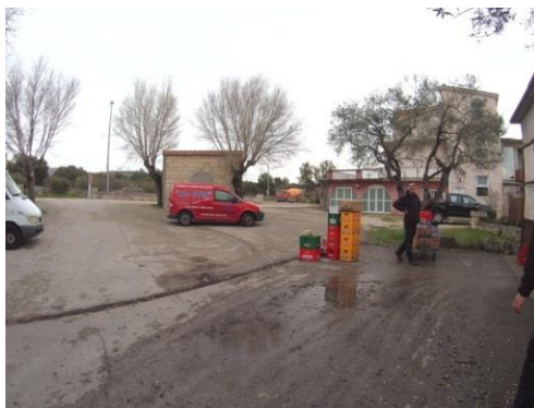
Slika 8: okolina skladišta

Skladište je locirano na ulazu u Rogoznicu, što je izrazito blizu kupcima robe na područjima prema Šibeniku. Lokacija i okolina skladišta su jako važni kako bi se olakšao prijevoz robe i smanjilo vrijeme dostave. U ovom prodajno-distribucijskom centru je pogodno što se skladište nalazi u neposrednoj blizini Jadranske magistrale, s koje se može direktno pristupiti centru. U krugu skladišta se nalazi prostrani parking za vozila centra, sa dovoljno parkirnih mjesta za dobavljače i za kupce.