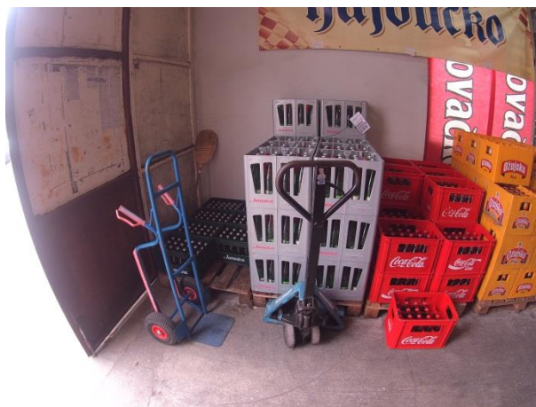
Slika 14: Ručna kolica i viličar

transportna sredstva s ručnim upravljanjem 43 , te se sastoje od dva kotača, površine na koju se stavlja roba i dvije ručke. U slučaju da je narudžba opsežna, djelatnici će robu posloženu na palete premjestiti pomoću viličara, koji spada u transportna mehanizirana sredstva 44 i koristi se za dizanje i spuštanje paleta.