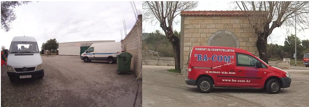
Slike 12 i 13: Transportna vozila

Transport je važan u poslovanju prodajno-distribucijskog centra u Rogoznici jer djelatnici nastoje da se sva roba koju kupci naruče isporuči u najkraćim rokovima, sigurno i kvalitetno. Uz prijevoz robe, transport obuhvaća i poslove koji se odvijaju prije i nakon prijevoza, a to su utovar i istovar robe. Ovaj prodajno-distribucijski centar se koristi kopnenim prijevozom, odnosno sav prijevoz robe se odvija cestovnim prometom. Centar se nalazi na samom ulazu u Rogoznicu, u neposrednoj blizini Jadranske magistrale. Jadranska magistrala je državna cesta koja povezuje razna mjesta duž Dalmacije, što pogoduje bržoj dostavi robe kupcima. Vozni park se zbog izrazite sezonalnosti posla mijenja tijekom godine. Izvan sezone se vozni park sastoji od dva kombija marke Iveco i jednog Caddyja, a taj se broj za vrijeme sezone povećava na četiri kombija i dva Caddyja. Djelatnici dodatna vozila nakon sezone odvođe u distribucijski centar koji se nalazi u Žrnovnici, gdje se nalaze do sljedeće sezone.