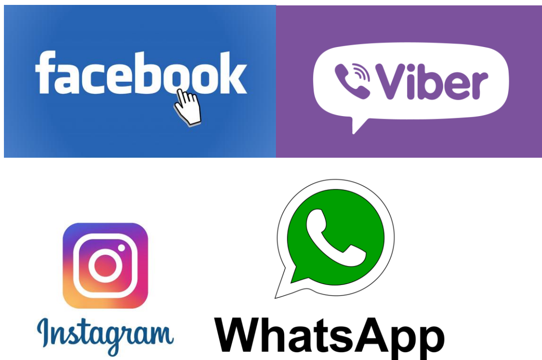
Slika 2: Prikaz logo-a navedenih aplikacija.

Dok su za poslovanje razne bankarske aplikacije te za društvene mreže Facebook, Instagram i Twitter.