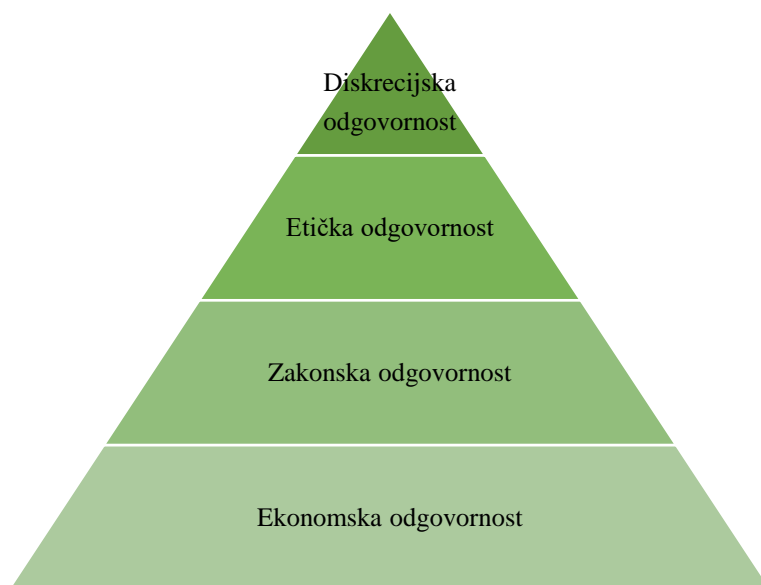
Slika 1: Piramida društvene odgovornosti, prema A. B. Carrollu

Gornji opisi predstavljaju početni Carrollov definicijski okvir o DOP-u, kojega je autor revidirao 1991. godine, sa svrhom pružanja detaljnijeg shvaćanja o diskrecijskoj odgovornosti. U ponovljenom pregledu ovog elementa, Carroll ističe njegovu filantropsku prirodu te sugerira da ta razina znači prisvajanje „korporativnog građanstva“ 22 . Nadalje, Carroll sažeto argumentira, da kako bi savjesna poslovna osoba mogla prihvatiti DOP, taj koncept mora biti uokviren na način da obuhvaća cijeli spektar poslovnih odgovornosti. Te poslovne odgovornosti mogu se kategorizirati u četiri već spomenute skupine, a koje se mogu prikazati u obliku piramide. 23