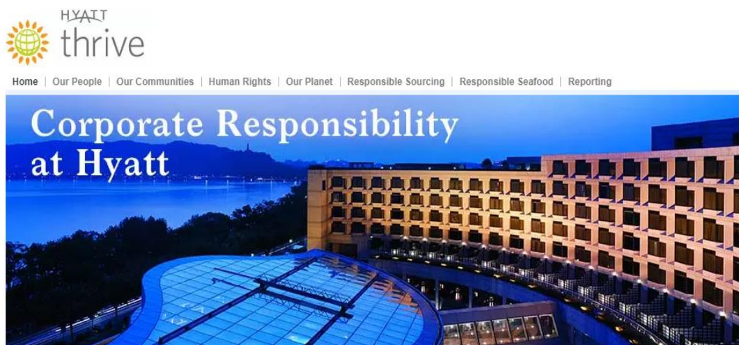
Slika 2: Hyatt thrive, globalna platforma Hyatt hotelske korporacije posvećena DOP-u

Kasnih 1990-ih godina, veliki međunarodni hotelski lanci pokrenuli su različite programe koji su im poslužili kao temelj za predstavljanje odgovornog poslovanja. Danas, većina velikih međunarodnih hotela na svojim internetskim stranicama objavljuje izvješća o DOP-u. 72 Veliki hotelski lanci sa snažnim brendom poput Marriotta, Hilltona, Radissona, Hyatta itd. na svojim službenim stranicama imaju i posebnu sekciju posvećenu DOP-u. 73