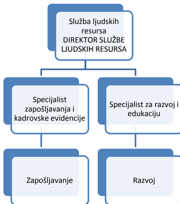
Slika 3. Organigram službe upravljanja ljudskim resursima;