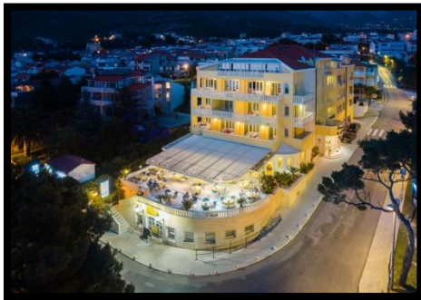
Slika 2. Hotel Villa Bacchus

Mjesto upisa u trgovački sud i broj upisa: Trgovački sud u Splitu, br. MBS: 1574965 sa sjedištem u Baškoj Vodi gdje se nalazi i sama Villa Bacchus.