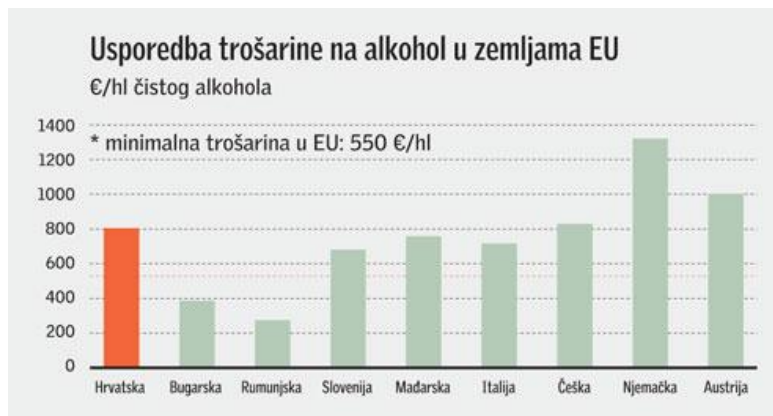
Slika 1 – usporedba trošarine na alkohol u zemljama EU