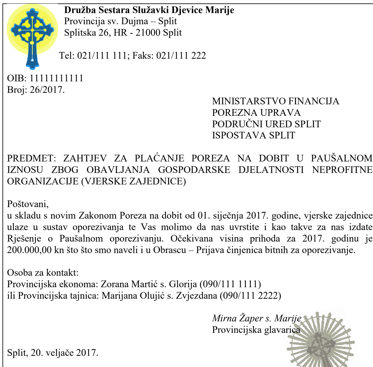
Slika 2: Zahtjev za plaćanje poreza na dobit u paušalnom iznosu od strane Provincije Sestara Služavki Djevice Marije

Zahtjev za utvrđivanje paušalne obveze, te obrazac za prijavu činjenica bitnih za oporezivanje, upućeni nadležnoj ispostavi PU, su kako slijedi.