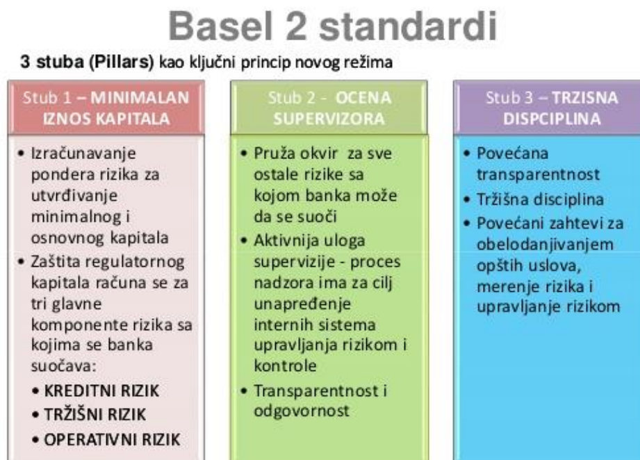
Slika 2. Struktura basela II

Stupovi su međusobno komplementarni i postojanje jednog ne uspijeva bez postojanja drugog, tj svaki od njih omogućuje nešto što druga dva nisu u mogućnosti pružiti. Sva tri stupa imaju za cilj sustavno i kvalitetno upravljati rizicima na mikrorazini, te ostvariti stabilnost financijskog sustava u makroekonomskom pogledu.