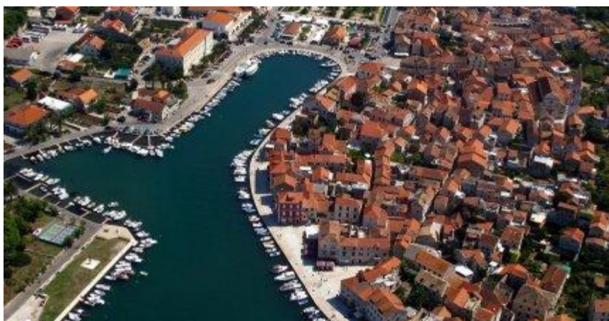
Slika 7: Prikaz luke Stari grad na Hvaru

Hvarska luka spada u one rijetke što ih se ljeti može prijeći s jedne strane na drugu, preko mora, po suhome. Preko brodica, dakako. Jer toliko je jahti i jahtica u njoj natisnuto u sezoni da se more i ne vidi. I sve buja od života. Tradicija uplovljavanja u hvarsku luku starija je od samoga grada Hvara jer su tu, zbog nautičkog položaja luke, zaklon tražili pomorci i ribari još iz doba staroga Pharosa. Hvar ih je kao svjetionik (što samo ime za cijeli otok na grčkome znači) vodio u prirodan zaklon od valova i vjetra. Od samih početaka plovidbe jedrenjaka današnji je Hvar bio u centru svih morskih putova.