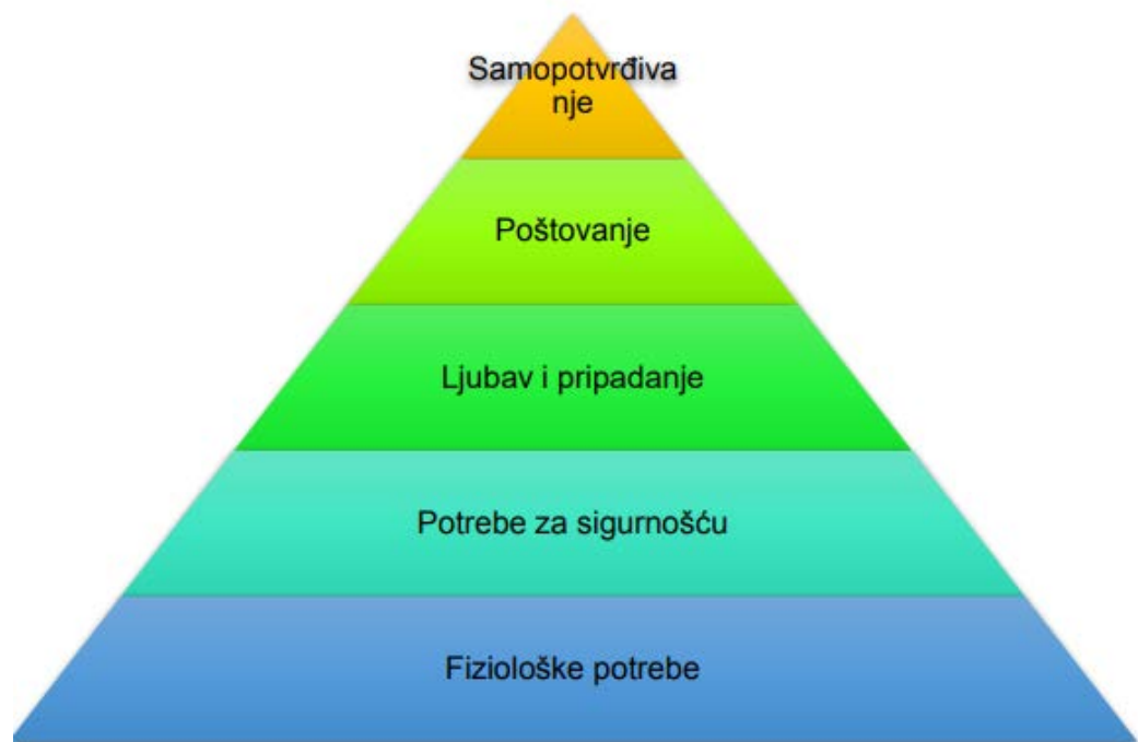
Slika 2 – Maslowljeva hijerarhija potreba

Po njemu, ljudi imaju potrebe nižeg reda kao što su fiziološke potrebe, potrebe za sigurnošću te društvene potrebe i potrebe višeg reda koje uključuju potrebe za poštovanjem te potrebe za samoaktualizacijom. Ova podjela se može bolje objasniti uz pomoć sljedeće slike.