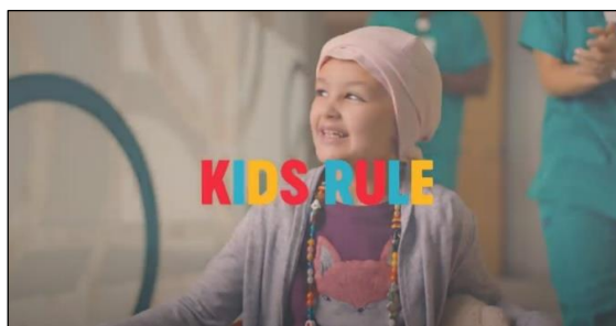
Slika 3: Isječak iz oglasa „Children’s Health / Kids Rule – Party“

Djelatnici bolnice, stečenim iskustvom te dugogodišnjim radom s djecom, nastoje osigurati ugodnu atmosferu u bolnici kako za djecu, tako i za njihove roditelje.