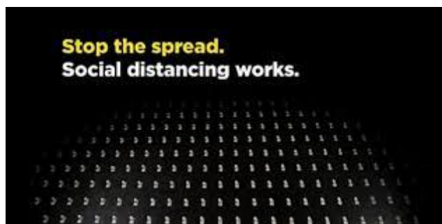
Slika 1: Isječak iz oglasa „ Mouse traps and ping pong balls to show powerful message: Social distancing works“

Izabrani oglas pojavljuje se na društvenim mrežama kao što su Facebook, Youtube i dr.