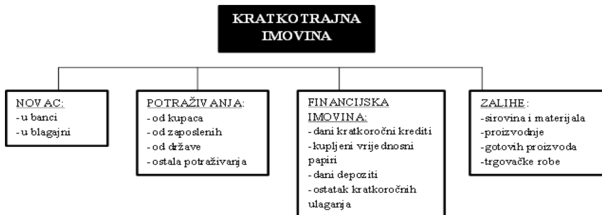
Slika 2: Kratkotrajna imovina

Za potrebe poslovnog odlučivanja podjela imovine na dugotrajnu i kratkotrajnu je nužna, ali ne i dovoljna. Stoga se ti osnovni oblici dalje sistematiziraju na nekoliko osnovnih pod oblika (Slika 2 i Slika 3). 14