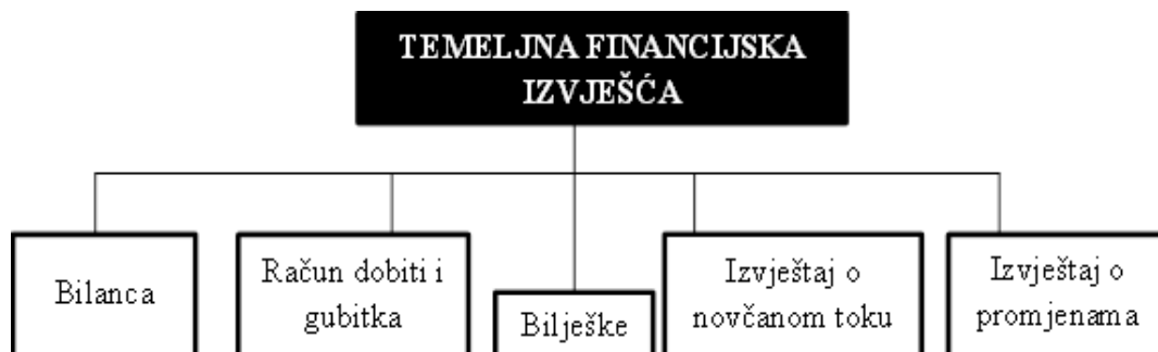
Slika 1: Temeljni financijski izvještaji

Svi izvještaji (Slika 1) međusobno su povezani. Neki su statističkog karaktera (npr. Bilanca), budući da prikazuju situaciju u određenoj točki vremena, dok drugi pokazuju promjene ekonomskih kategorija u određenom razdoblju te stoga imaju dinamički karakter (npr. Račun dobiti i gubitka). 9