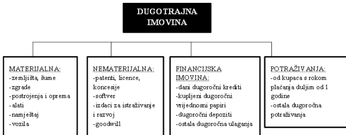
Slika 3: Dugotrajna imovina