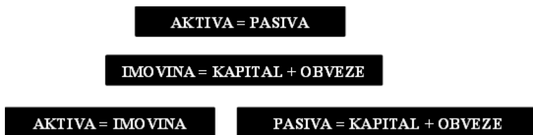
Slika 4: Bilančna ravnoteža

Razlika između ukupne imovine i ukupnih obveza čini vlasničku glavnica odnosno kapital poduzeća što je bolje prikazano na Slici 4.