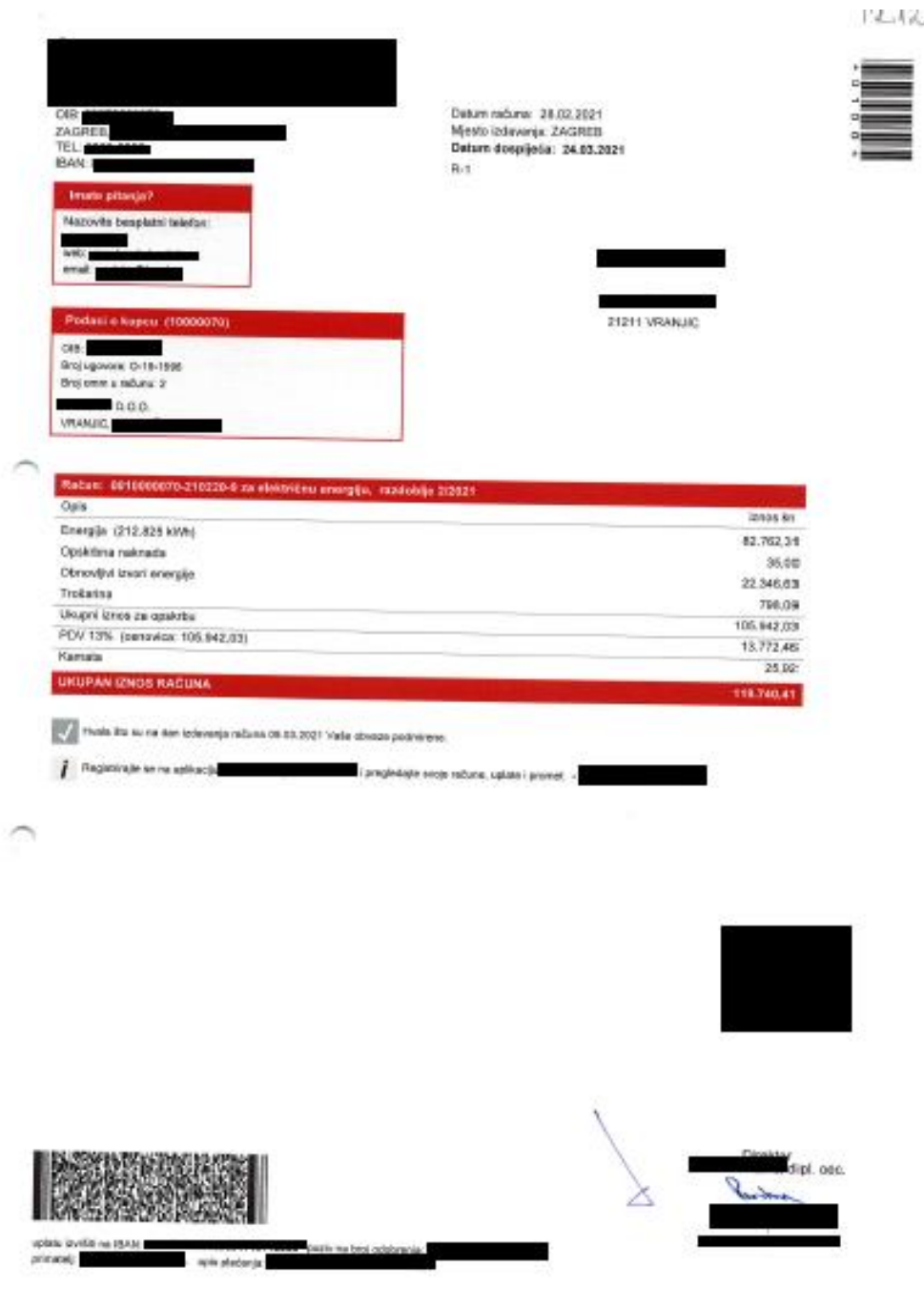
Slika 3.Primjer ulaznog računa – trošak električne energije

Poduzeće je 28.02.2021. dobilo račun HEP-a za električnu energiju.