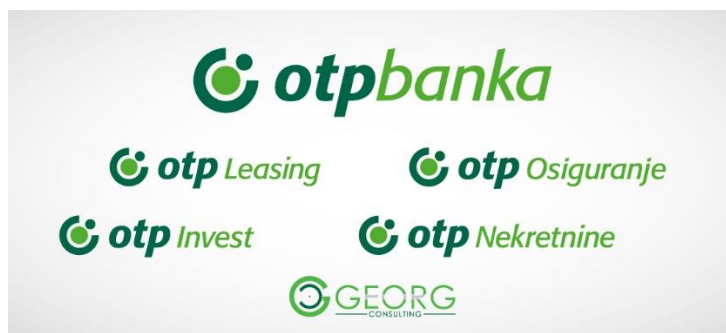
Slika 2. – Članice OTP grupe