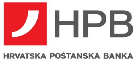
Slika 4. Logo HPB banke