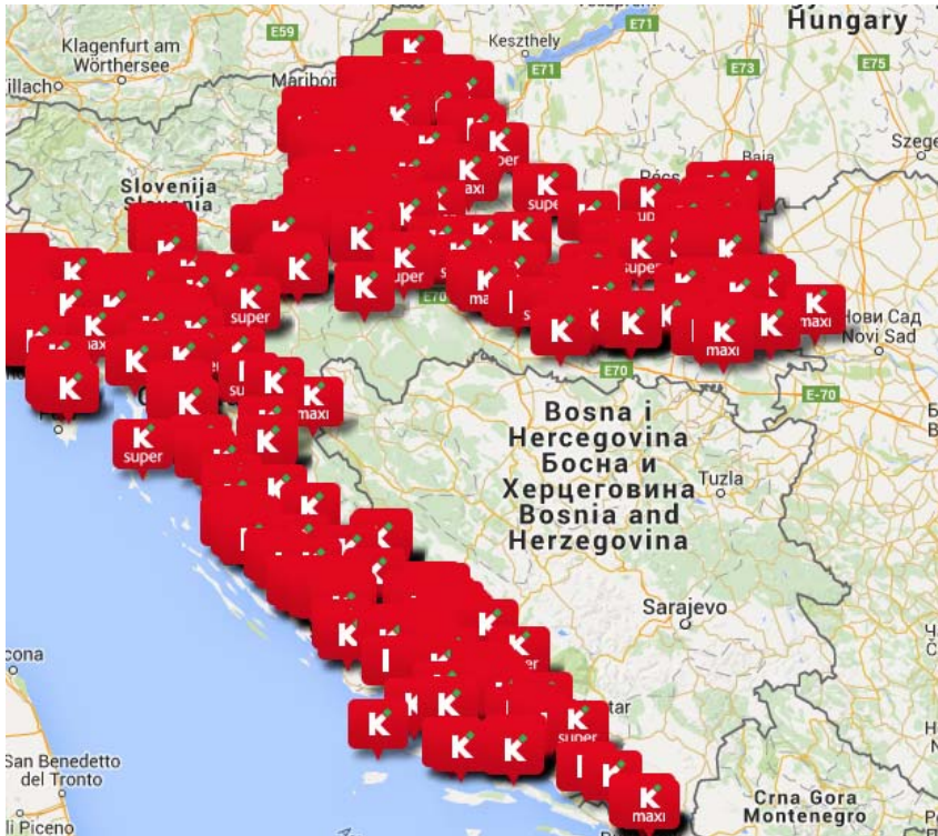
Slika 2: Konzum prodavaonice u Republici Hrvatskoj

Konzum d.d. je dioničko društvo, čija je osnovna djelatnost trgovina ma veliko i malo. Sjedište poduzeća je u Zagrebu, na adresi Marijana Čavića 1a. Poduzeće je osnovano 1957. godine, te registrirano na Trgovačkom sudu u Zagrebu. Temeljni kapital društva koji je uplaćen u cijelosti iznosi 227.028.600,00 kuna.