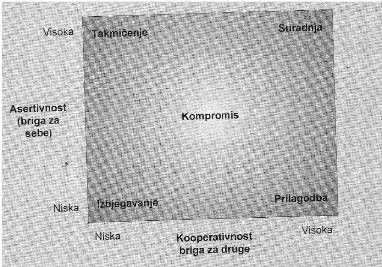
Slika 1. Model stilova upravljanja konfliktom

Izvor: Buble M. (2011.): op. cit., str. 195.