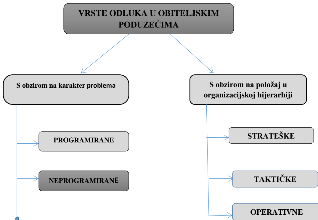
Slika 2: Vrste odluka u obiteljskim poduzećima