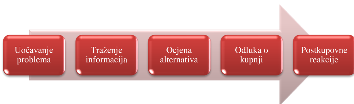
Slika 4. Proces donošenja odluke o kupovini

Proces donošenja odluke o kupnji je proces kroz koji prolaze osobe koje su odlučile kupovati neki proizvod/uslugu, a taj je proces pod utjecajem mnogih čimbenika i marketinških aktivnosti poduzetničkog subjekta (Grbac i Meler, 2007).