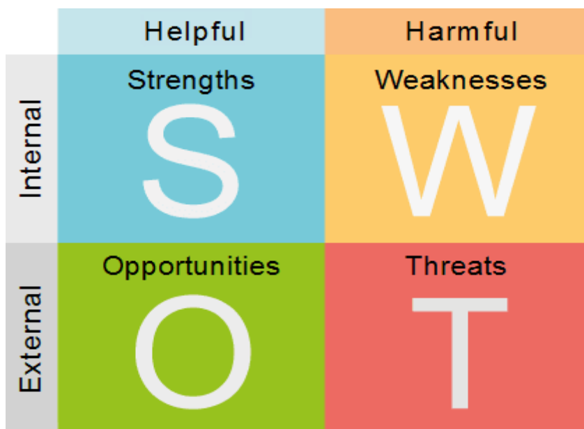
Slika 2: SWOT analiza