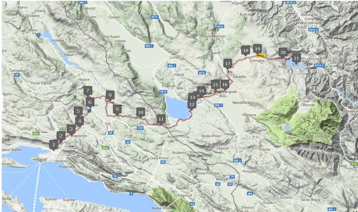
Slika 1. Karta projekta "Staza Gospi Sinjskoj"