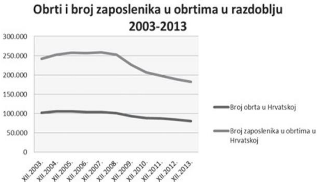
Slika 1. Obrti i broj zaposlenika u obrtima od 2003. do 2013. godine.

Izvor: Ukić, Lj., Martić Kuran, L. (2015.), Uloga i značaj malih i srednjih poduzetnika na ruralnim područjima Dalmatinske Zagore, Zbornik radova Veleučilišta u Šibeniku (1-2): 221-229.