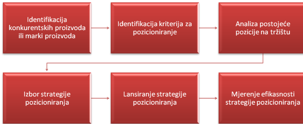
Slika 1. Proces oblikovanja strategije pozicioniranja