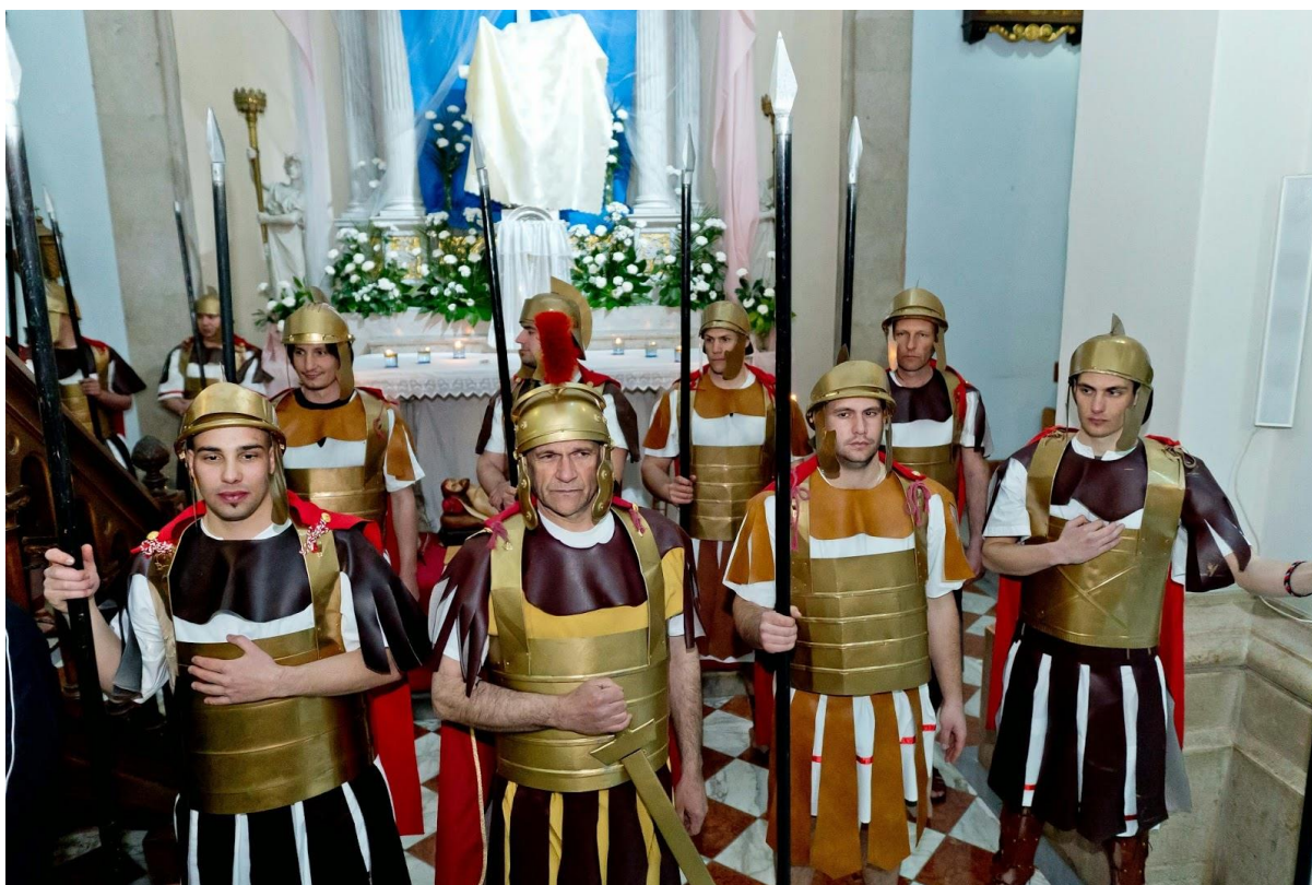
Čuvari Kristova groba (žudije) u Imotskom 90