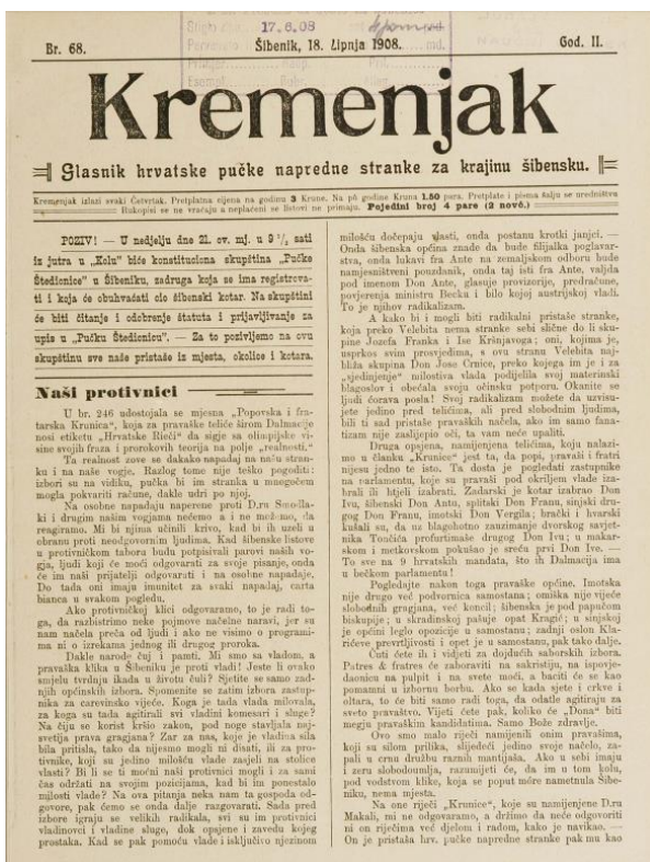
Slika 1. Naslovnica časopisa Kremenjak, br. 68., 1908

to je bilo društveno, društvena norma. Prvo šta su to bili vjerojatno mlađi momci, iako oni dokumenti šta ih mi imamo, to je baš vridno za spomeniti, ima ih tri-četiri šta je župnik da, di piše kako su oni pisali molbu za ući u žudije. Nisu pisali oni u svoje ime, nego su pisali stariji, kao u ime bratovštine, da predlažu tih pet i moli se da se to zadrži u tajnosti ako slučajno ne bi župnik odobrija da oni mogu biti. To su dokumenti iz '41. i '28. i još piše: te napominjemo da nisu u nikakvoj stranci, „stranki“, niti u društvu i tako dalje i moli se da se zadrži u tajnosti ako ne bi uspili ući u žudije. Znači, isto to nije bilo baš bez veze, isto si ti mora nekako; moralo te primiti na osnovu nečega. 60