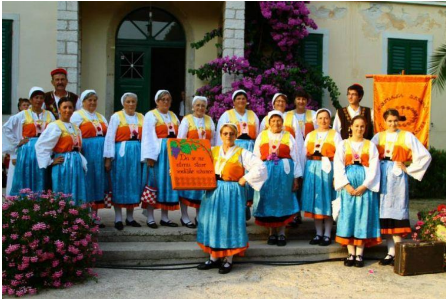
Slika 3. Vodička narodna nošnja (svečana); na fotografiji su članice i članovi KU Vodiške perlice

Ka radnu robu, trliš nosili su košuju ili majicu i na glavi klobuk. 115