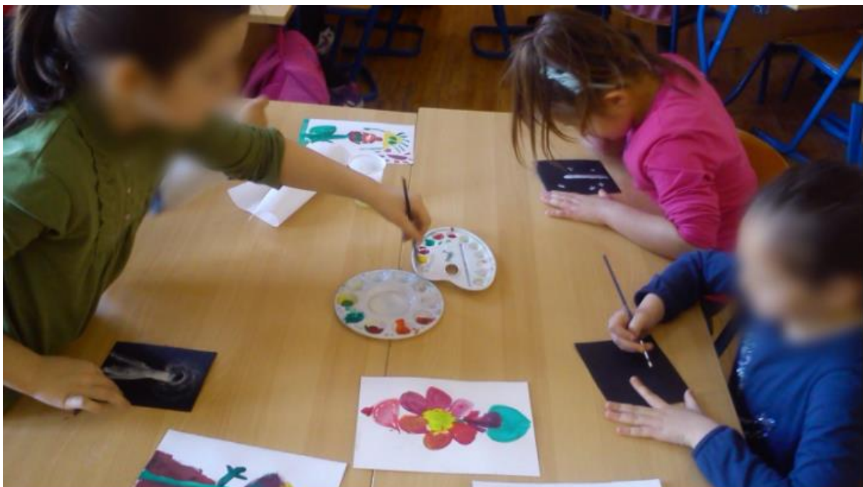
Slika 1. Učenici OŠ Spinut slikaju plesne haljine cvjetova

Pljeskom se vraćamo u stvarni svijet. Učenici izražavaju dojmove.