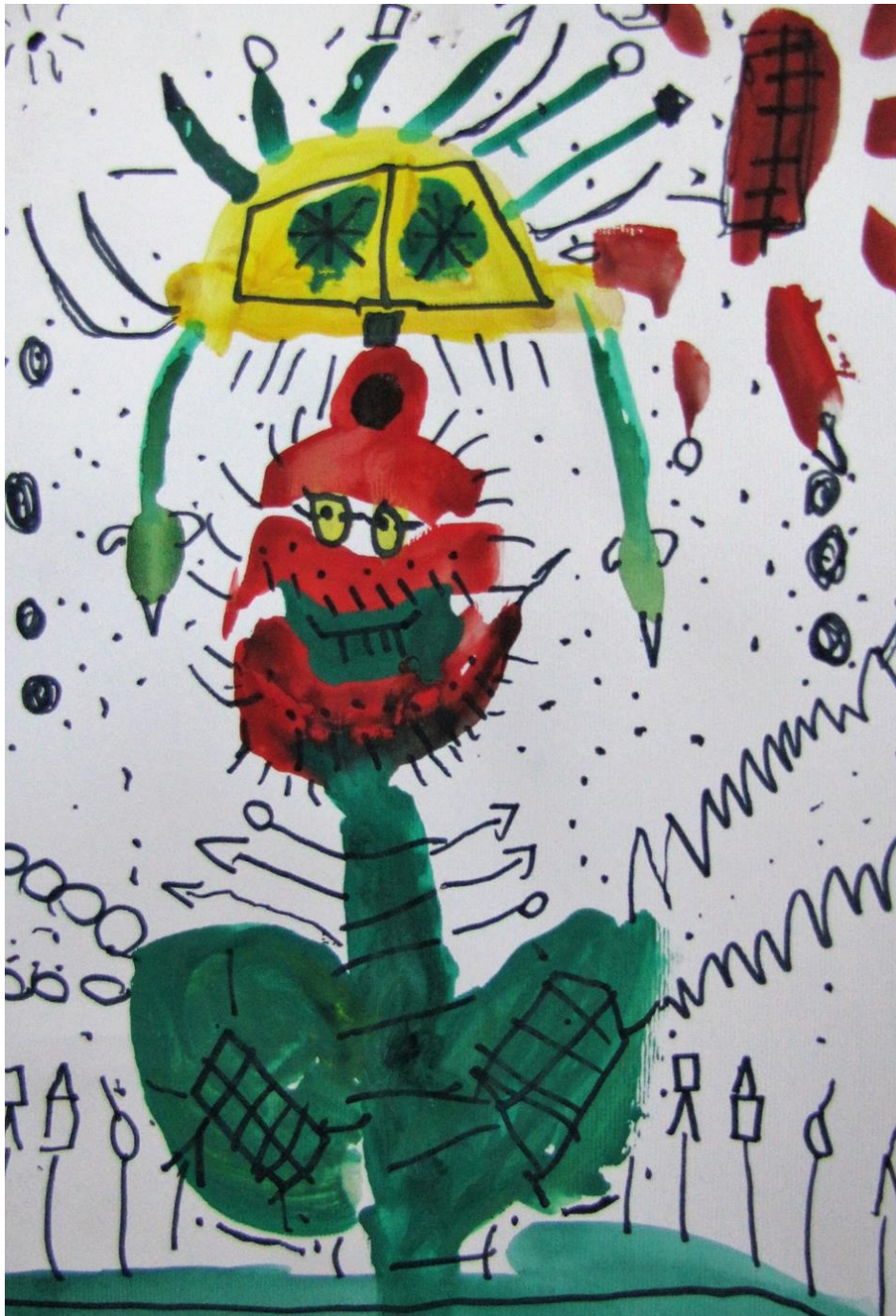
Slika 3. Učnikov rad