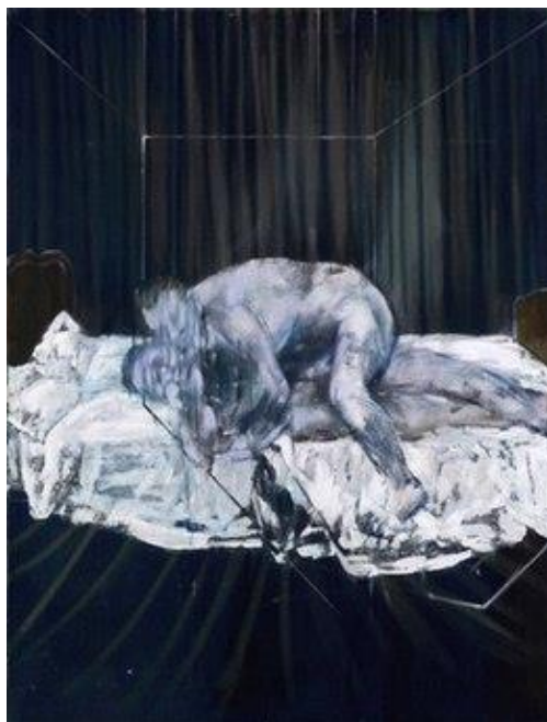
Slika 15. Francis Bacon, Two Figures , 1953.