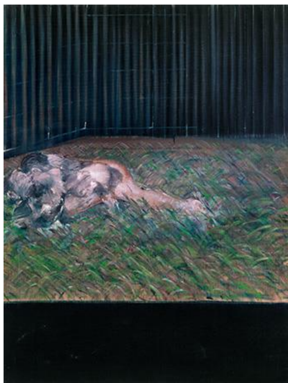
Slika 16. Francis Bacon, Two Figures in the Grass , 1954.