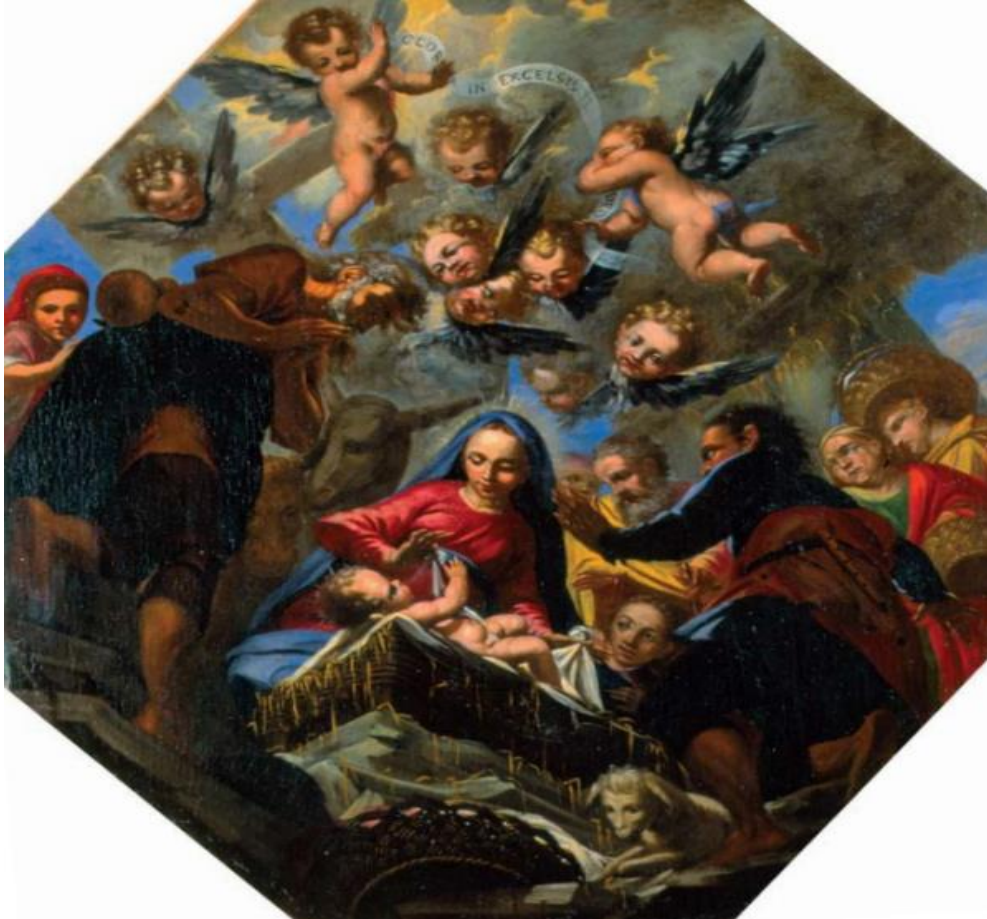
Slika 24. Poklonstvo pastira (Rođenje Kristovo)

Barokna pobožnost koja povlači Bogorodičinu svijest da će njezin Sin svijet spasiti svojom smrću u svjetlosti Šimunovog proročanstva tumačila je niz tema iz Bogorodičinog života između ostalih i Prikazanje Krista u hramu. Temom Bijeg u Egipat nastavlja se Marijina patnja i stradavanje. Ona hoda noseći Krista u naručju te je Josip brižno očekuje u podnožju stepenica. Rasprava dvanaestogodišnjeg Krista sa židovskim misliocima (tema Krist propovijeda u hramu) u Gospi od Škrpjela prikazana je u skladu s interpretacijama toga vremena ove teme. Osnovna ikonografska shema koja je formirana od srednjeg vijeka, polazi od antičkih prikaza razgovora filozofa. Krist većinom sjedi na katedri, okružen židovskim svećenicima, dok u drugom planu stoje zabrinuti roditelji. 95