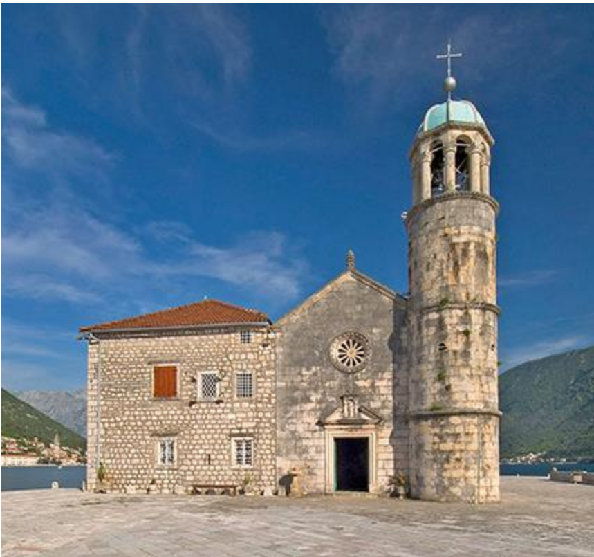
Slika 2. Pročelje crkve

Crkva je malena opsegom, jednostavne, ali bogate vanjštine. Ukusno je rađena od finog korčulanskog kamena. Sastoji se od obične lađe i kapele koja je presvođena kupolom. Ukas na glavnim i pobočnim vratima je renesansa koja prelazi u barok, rađen početkom 17. stoljeća. Nad glavnim vratima, u udubini izrađenoj u obliku portala, nalazi se kip presvete Djevice s Djetetom arhaičnog držanja. Na pročelju je romanička zvijezda. Ukas ispod obruba na krovu je po uzoru renesanse. Kupola je nad žrtvenikom visoko 11 metara, s križem na vrhu 12 i pol metara. 18 Podignuta je 1722. 19