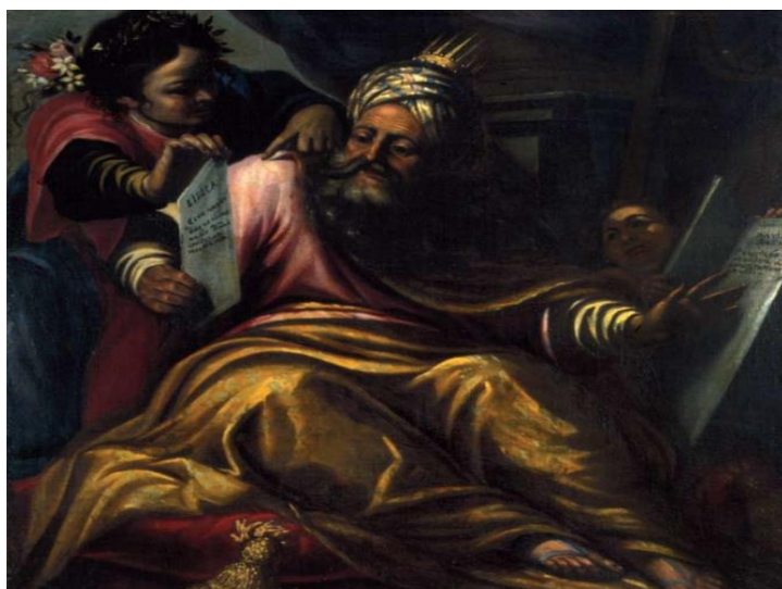
Slika 15. Kralj David i libijska proročica, Gospa od Škrpjela, Perast

Zaharija i europska sibila, Izaija i delfijska sibila, Jeremija i eritrejska sibila, Habakuk i samijska sibila, Balaam i helespontska sibila, Baruh i kumejska sibila nalaze se na sjevernom zidu u donjem redu. Gornji red ima dva velika platna: Silazak Duha Svetog te kompozicija na kojoj je prikazano Odbijanje darova Joakima i Ane, Naviještanje Joakimu i Bogorodica Bezgrešnog Začeca. 65