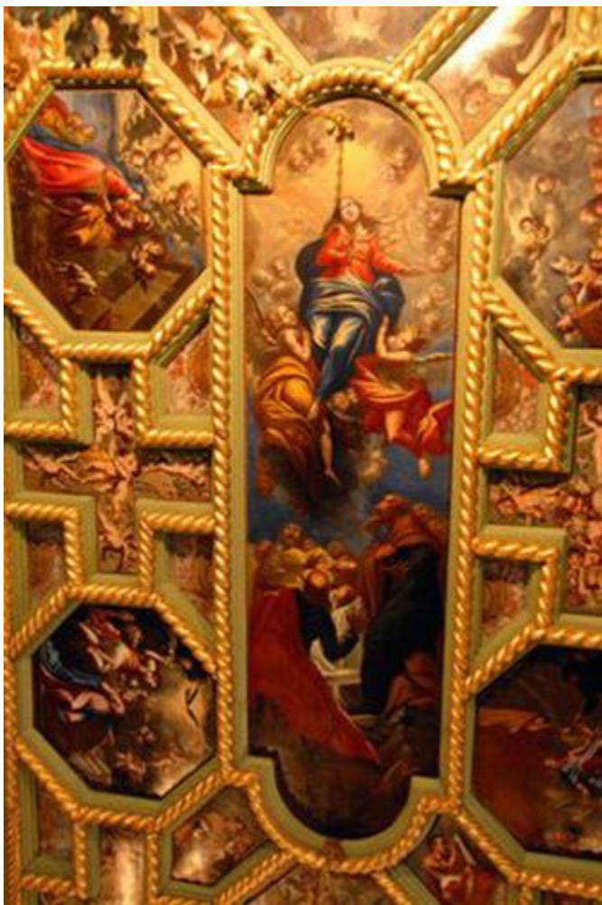
Slika 21. Uznesenje Bogorodice

Kod Uznesenja, apostoli ostaju kraj praznog Bogorodičinog groba dok prate njezin trijumfalni uspon ka nebu. Kraj Marije su anđeli. 89