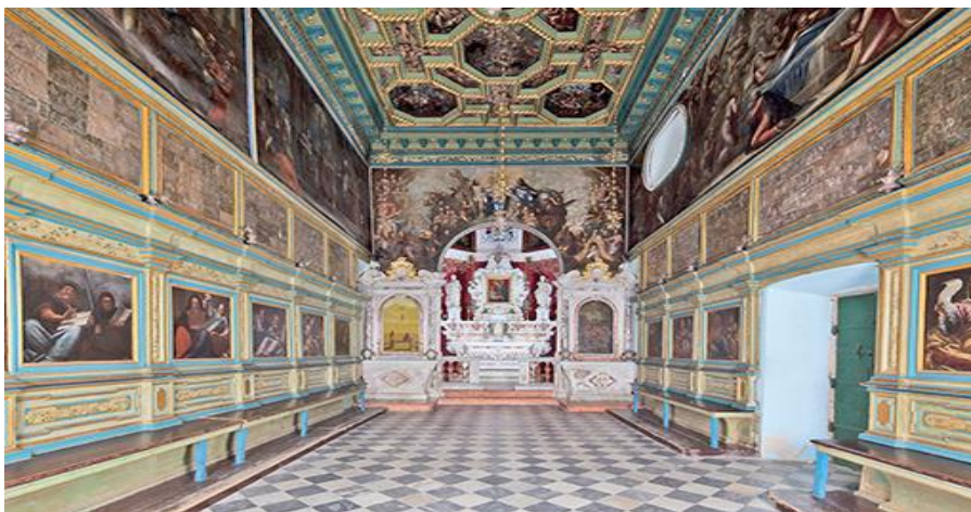
Slika 5. Unutrašnjost svetišta

slikama i uređenjem prezbitarija. Kupola je iznutra skladno spojena zavojnicama sa svojom kvadratnom podlogom. 28