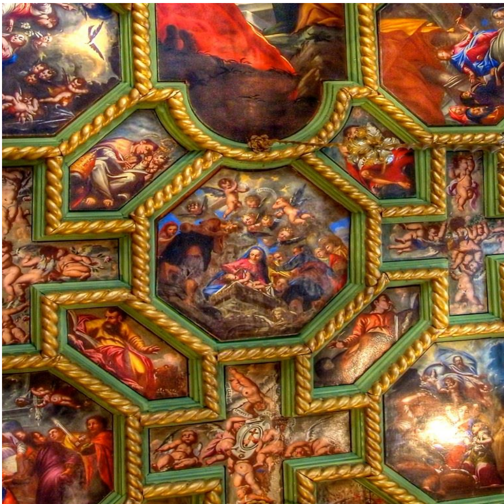
Slika 25. Detalj ciklusa sa stropa

sveti Jerolim te straga s gornje strane sveti Lav Veliki i s donje strane sveti Ambrozij. Uz dvije osmokutne slike koje se nadovezuju na zaobljene okrajke Uznesenja prikazani su u nepravilnim šesterokutima četiri evanđelista. Sprijeda su Marko i Ivan, a straga Luka i Matej. Prikazani su sa svojim simbolima te sjede gotovo ležeći u dužini slike. Oci Crkve sjede uspravno u širini slike. Između osmerokutnih slika na stropu nalaze se prikazi anđela. Uokvireni su u obliku križa te ih je ukupno osam. 96