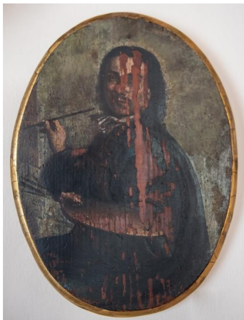
Slika 12. Autoportret Tripa Kokolje, Zavičajni muzej Perast

smrti. Manjak izvornih svjedočanstava nadoknađen je tijekom 19., 20. i 21. stoljeća. Tada su o njemu pisali i lokalni pisci i mnogi povjesničari umjetnosti. 53