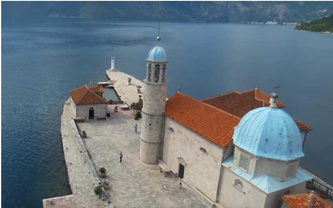
Slika 3. Kupola nad žrtvenikom

Na vrhu je pozlaćen grčki križ. Četverokutna osnova kupole ima tri prozora u stilu renesanse. 20