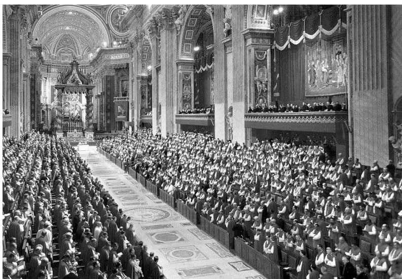
Slika br. 4. Drugi vatikanski koncil 1962. godine

( https://www.enciklopedija.hr/natuknica.aspx?ID=47088 ; 3. 9. 2020.)