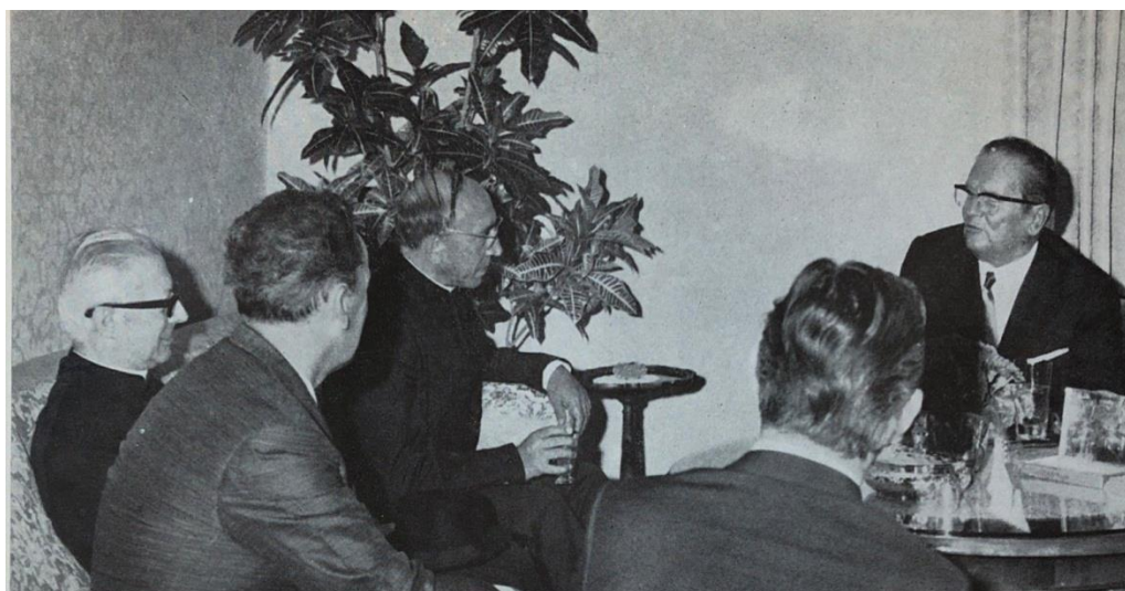
Posjet Agostina Casarolija Josipu Brozu Titu na Brijunima 26. 8. 1970. godine (CVRLJE, V. (1980). Vatikan u suvremenom svijetu , Zagreb: Školska knjiga.)