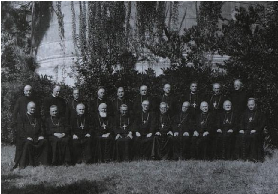
Sudionici Biskupske konferencije Jugoslavije 22. rujna 1961. godine, kojom je predsjedao Franjo Šeper.

(CVRLJE, V. (1980). Vatikan u suvremenom svijetu , Zagreb: Školska knjiga.)