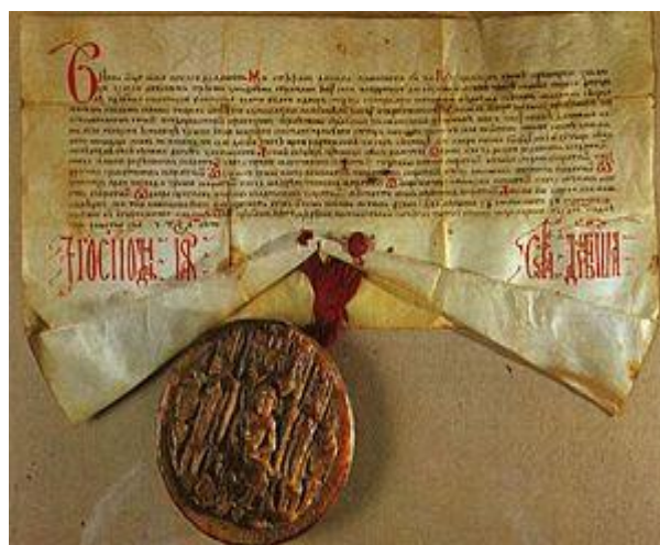
Slika 2 Darovnica bosanskog kralja Stjepana Dabiše kćeri Stani

Nadalje, o postojanju srednjovjekovnog ljubušskog kraja kao i o njegovu razvoju govori nam i humačka ploča iz 11./12. st. koja svjedoči kako je se i na tim prostorima razvijala glagoljska i ćirilična pismenost.