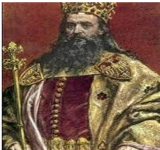
Slika 1 Bosanski kralj Stjepan Dabiša

Da je Ljubuški kraj nastanjen od starih vremena svjedoči nam darovnica bosanskog kralja Stjepana Dabiše, nasljednika loze Kotromanovića. U njoj, 1395.g., kralj Stjepan daruje selo Veljake u Humskoj zemlji svojoj kćeri Stani, a nakon njezine smrti treba ga naslijediti njezina kćer Vladica i njezin muž knez Juraj Radivojević. U darovnici se navode i brojni svjedoci, kao i kletva kojom se proklinje svatko tko isto opovrgne. Darovnica je sačuvana i danas se čuva u Državnom arhivu Bosne i Hercegovine u Sarajevu. 2