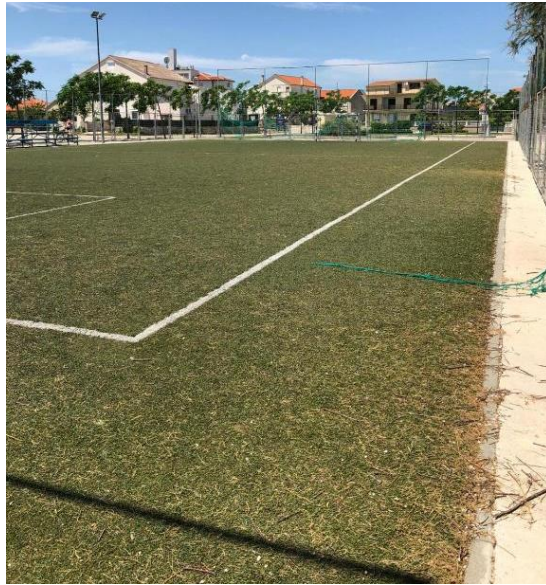
Slika 39. Travnato malonogometno igralište u uvali Zdrače. (Prikaz autora)