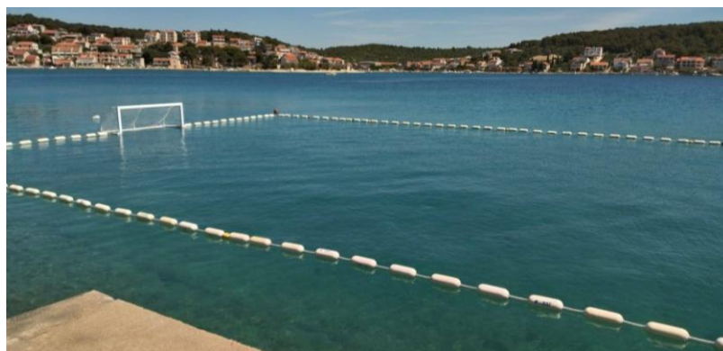
Slika 28. Postojeće vaterpolsko igralište Vaterpolo kluba Tisno .

Klub čini sve kako bi djeca mogla imati još jednu mogućnost za zabavu preko ljeta i stjecanje radnih navika. Trude se da djeca zdravo žive, da budu dobro odgojena te da budu primjer drugima. Pokušava ih se što više zainteresirati, ne samo za vaterpolo, već za bavljenje sportom općenito, kroz cijelu godinu. Klub je financiran iz proračuna Općine Tisno, iz sponzorstava i donacija te iz članarina koje iznose 100 kn za srpanj i kolovoz. Nastoji se nabaviti reflektore za postojeće vaterpolo igralište kako bi vaterpolo bilo moguće igrati i u noćnim satima. Slijedi i nabava pontona kojima bi se vaterpolo igralište „zatvorilo“ u jednu cjelinu. Sve navedeno je u cilju opstanka VK-a Tisno .