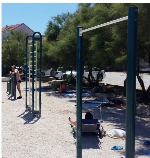
Slika 35. Sprave za vježbanje na plaži Luke.