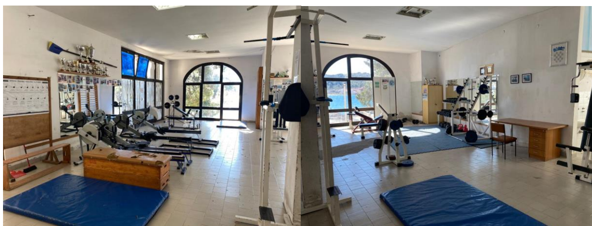
Slika 24. Teretana u prostoru bivšega odmarališta Općine Tuzla. (Prikaz autora)

Potrebno je naglasiti da je veslačka oprema izuzetno skupa i vrlo ju je teško nabaviti. Klub je godinama nabavljao veslačke čamce uz pomoć prijatelja i ponajviše roditelja bivših veslača. Čamac za jednoga veslača košta od 50 do 70 tisuća kuna; četverac košta blizu 140 tisuća kuna; par vesala 50 tisuća kuna, stoga 2000. g. jedan roditelj diže kredit i kupuje brod (dubl), a drugi roditelji se dogovaraju da će plaćati ratu kredita. Zatim jedan skif kupuju donacijama roditelja koje iznose 1500 kn. Preko natječaja Hrvatskoga olimpijskoga odbora Klub dobiva dva broda samca. U navedenom objektu uređena je i teretana, no trenutno se traži nova lokacija uz more gdje bi bilo moguće smjestiti Klub .