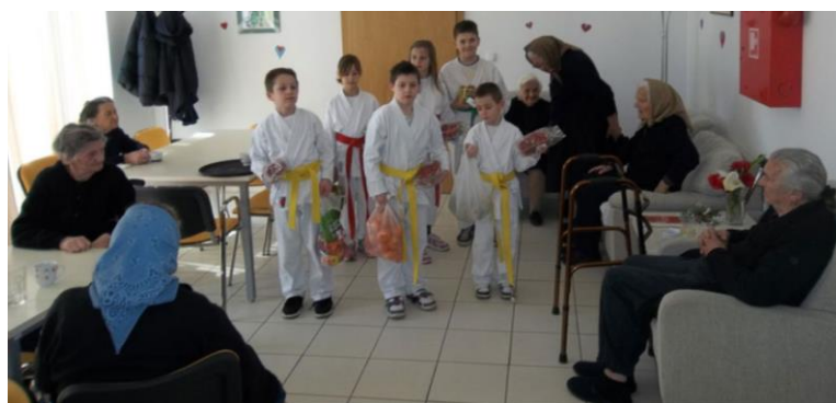
Slika 27. Polaznici Karate škole Tisno daruju korisnike Doma za starije u Tisnom . (Općina Tisno, 2016)