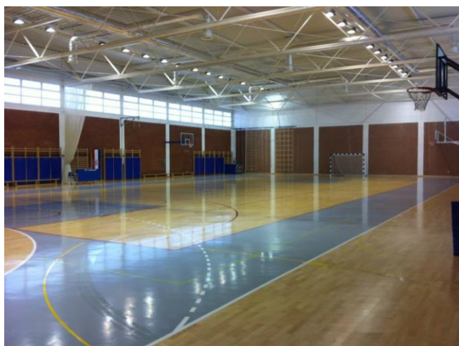
Slika 31. Sportska dvorana Murter. (Facebook stranica Sportska dvorana Murter , n. d.)

Mala dvorana ili dvorana za korektivnu gimnastiku koja se koristi u različite svrhe grupnog vježbanja, prostorija s opremom za karate te u podrumu dvorane nalazi se fitness teretana (Murtela, n. d.).