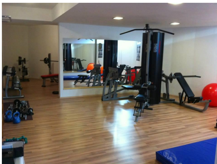
Slika 32. Fitness teretana Sportske dvorane Murter.

Mala dvorana ili dvorana za korektivnu gimnastiku koja se koristi u različite svrhe grupnog vježbanja, prostorija s opremom za karate te u podrumu dvorane nalazi se fitness teretana (Murtela, n. d.).