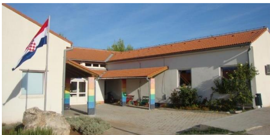
Slika 4. OŠ Vjekoslava Kaleba Tisno. (Osnovna škola Vjekoslava Kaleba, 2011)

Osnovnu školu Vjekoslava Kaleba pohađaju učenici iz Tisnoga i okolnih naselja, Jezera, Dubrave kod Tisna, Dazline i Ivinja. Matična škola nalazi se u Tisnom, a u Jezerima je Područni odjel. Područni odjel Jezera pohađaju samo učenici nižih razreda osnovne škole koji u petom razredu započinju pohađati matičnu školu u Tisnom. Učenicima iz Jezera, Dubrave kod Tisna, Dazline i Ivinja osiguran je prijevoz učeničkim autobusom. Učenicima je na raspolaganju sportska dvorana u Tisnom i travnato malonogometno igralište pokraj dvorane (Osnovna škola Vjekoslava Kaleba, n. d.).