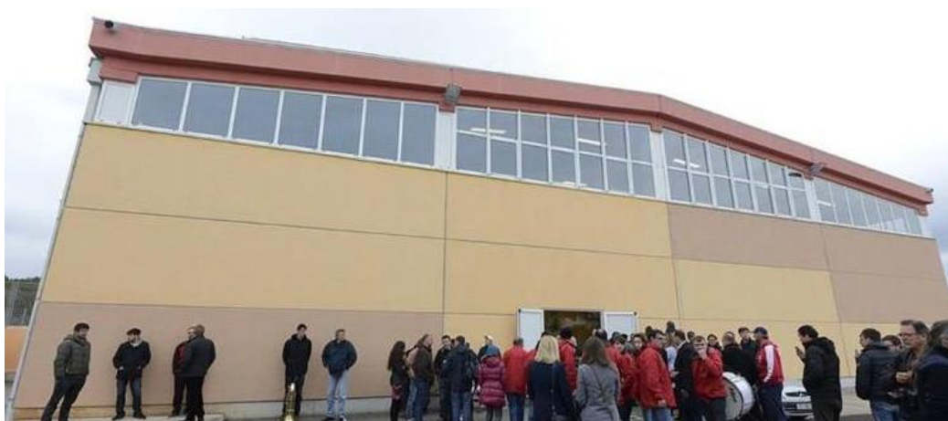
Slika 5. Sportska dvorana OŠ Murterski škoji. (Facebook stranica Sportska dvorana Tisno, n. d.)