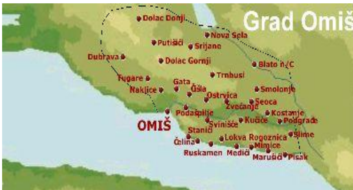
Slika 1. Omiška rivijera

Šire omiško područje obuhvaća Omiško primorje i Zagoru, a proteže se od ušća rijeke Žrnovnice kraj Stobreča pa sve do prijevoja Dubci (Vrulja), dok ga sa sjeverne strane omeđuje rijeka Cetina. 4 U sastavu grada Omiša danas se nalaze naselja: Blato na Cetini, Borak, Čelina, Čišla, Donji Dolac, Dubrava, Gata, Gornji Dolac, Kostanje, Kučiće, Lokva Rogoznica, Marušići, Mimice, Naklice, Nova Sela, Omiš, Ostrvica, Pisak, Podašpilje, Podgrađe, Putišići, Seoca, Slime, Smolonje, Srijane, Stanići, Svinišće, Trnbusi, Tugare, Zakućac i Zvečanje 5 (slika 1). Najveći dio tog prostora u prošlosti je pripadao autonomnoj općini Poljica.