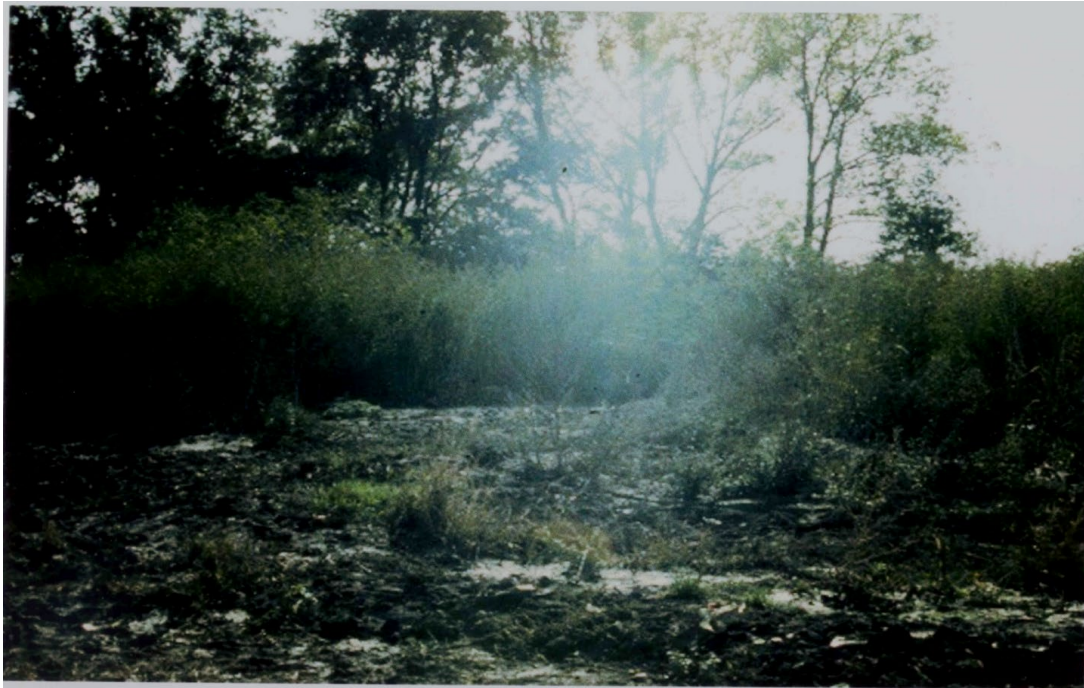
Slika 2. Mjesto pretpostavljene grobnice Ovčara.