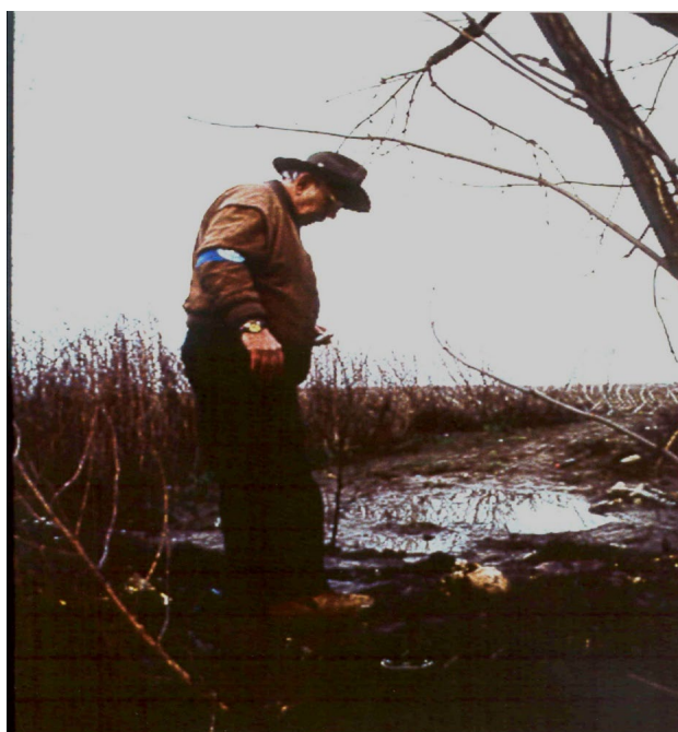
Slika 5. Ljudska lubanja i kosti pronađene na Ovčari 1992. godine.

Nakupljena voda sanirana je izradom drenažnog rova, a potom su s površine uklonjeni ostaci uginulih životinja i raznovrsnog otpada (15,77,85).