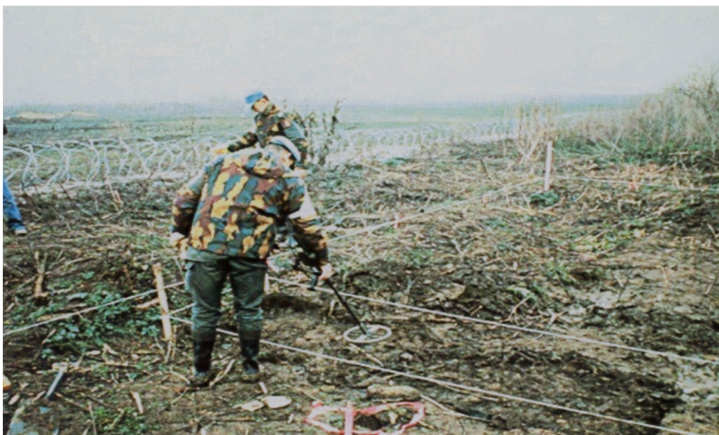
Slika 4 . Sigurnosno pretraživanje površine detektorom metala.