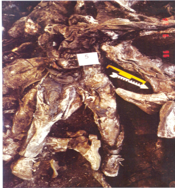
Slika 12. Prikaz izmiješanih tijela odjevenih u civilnu i radnu odjeću i obuću u masovnoj grobnici Ovčara.