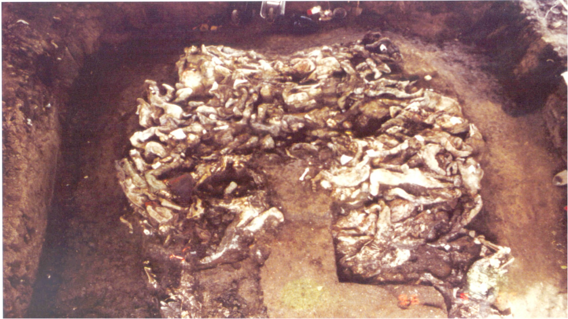
Slika 13. Isprepletenost tijela u masovnoj grobnici Ovčara.