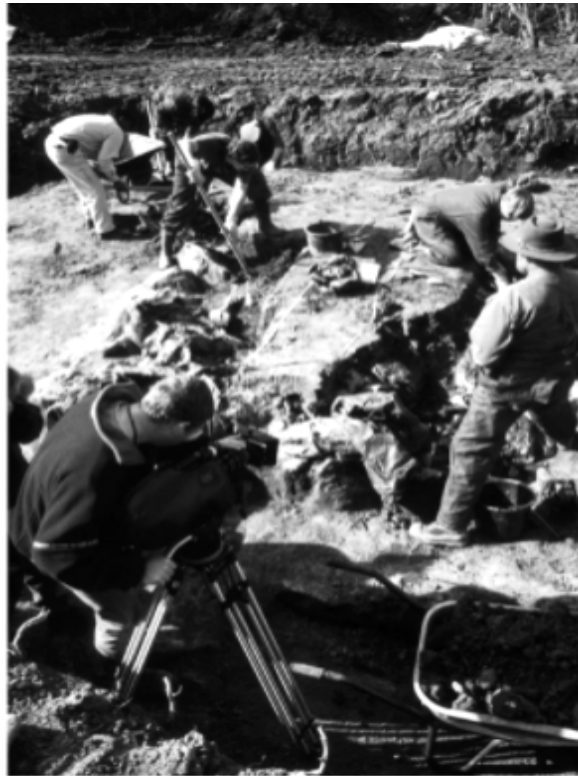
Slika 11. Ručno iskopavanje zemlje iz grobnice na Ovčari od strane PHR tima.

Ispitivanje grobnice započelo je utvrđivanjem njenih dimenzija i pregledom cjelokupne površine u potrazi za površinskim dokazima (90). Uklanjanje površinskog sloja zemlje strojevima, označio je početak ekshumacije, treći dan naišli su na crnu foliju kojom je po završetku preliminarnog istraživanja 1992. godine, prvi tim forenzičnih stručnjaka zaštitio koštane ostatke iz ispitnog rova. Ekshumacija je nastavljena ručnim kopanjem arheološkom metodologijom, što znači centimetar po centimetar, kako bi se sačuvala tijela i dokazi (89).