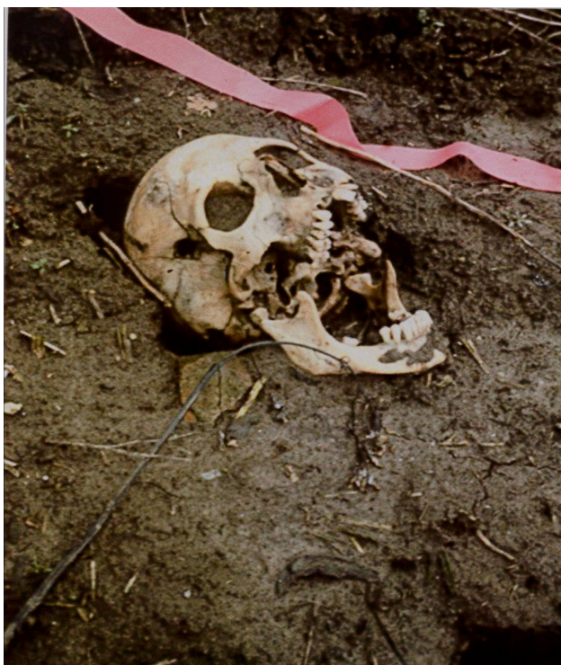
Slika 3 . Fotografija lubanje na površini masovne grobnice Ovčara.