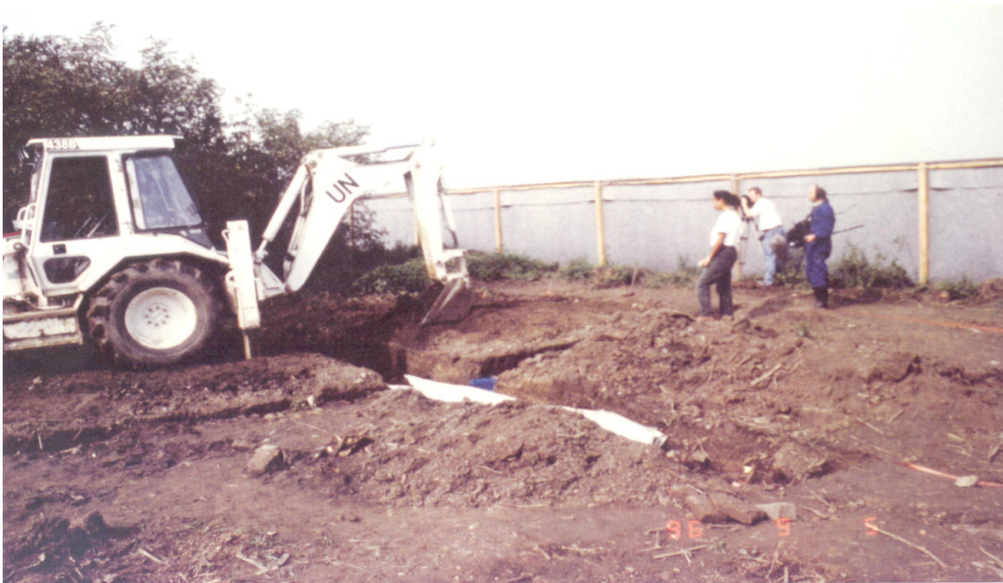
Slika 6. Iskopavanje ispitnog rova na Ovčari.

Vidljivi tragovi djelovanja teških strojeva na sredini grobnice upućivali su da je grobnica pretpostavljene veličine 7×9 m ciljano iskopana. Radi utvrđivanja dimenzija izvorne grobnice i njezinog sadržaja, napravljen je ispitni rov preko površine pretpostavljene masovne grobnice, veličine 1×7 m, dubine 80 cm, u kojoj je otkriveno devet tijela, koja su se dijelom ili cijelim tijelom nalazila u iskopanom rovu, u ležećem isprepletenom položaju bez ikakvog reda, čime je u potpunosti potvrđena izjava svjedoka o počinjenom zločinu na Ovčari. Prvi posmrtni ostaci pronađeni su na dubini od 22 cm, a ostali na početnoj dubini od 60 cm (15,86,87).