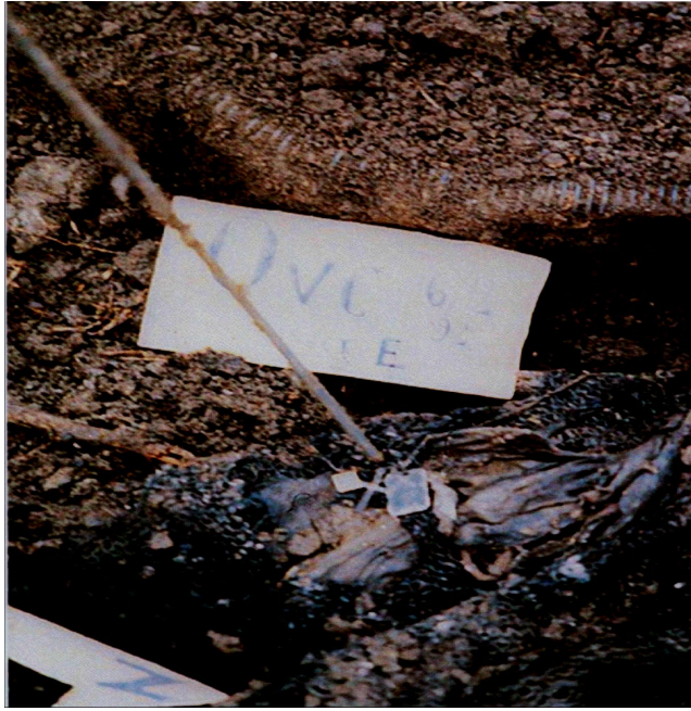
Slika 7. Ogrlica s katoličkim obilježjima pronađena na površini masovne grobnice Ovčara.