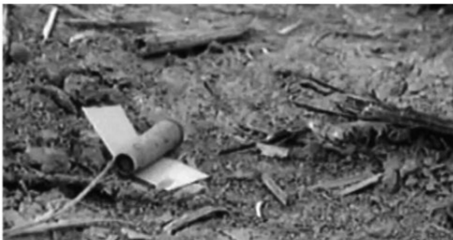
Slika 9. Potrošeno streljivo AK47 na površini masovne grobnice Ovčara.

Detaljnim pregledom okoliša, zapadno i sjeverozapadno od grobnice uočen je veći broj čahura kalibra 7,62×39 mm karakterističnih za oružje AK47 koje je svojevremeno koristila vojska JNA (15). Mjesto pronalaska ispaljenih čahura forenzične istražitelje doveo je do saznanja kako je pucano dijagonalno preko same grobnice, odnosno da su izvršitelji stajali uz sjevernu stranu grobnice udaljeni oko četiri metra od poljske ceste, a zarobljenici na južnoj ili jugoistočnoj strani. Zaključak da je ovo mjesto ujedno i grobnica i mjesto pogubljenja potkrijepljeno je pronađenim mnogobrojnim oštećenjima od metaka na drveću (84).