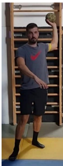
Slika 32. Jednoručno dodavanje uz otpor gumom na nadlaktici

Gumu s otporom zakačiti na nadlakticu dominantne ruke, zatim napraviti 3 koraka naprijed i dodati loptu suigraču koji se nalazi nasuprot. Ovu vježbu izvoditi maksimalnom brzinom kako bi otpor bio optimalan. Ovom vježbom jačaju se rotatori ramena i poboljšava se kontrola dodavanja i šutiranja zbog direktnog ometanja na dominantnu ruku igrača koji dodaje loptu. Vježbu ponoviti 10 puta.