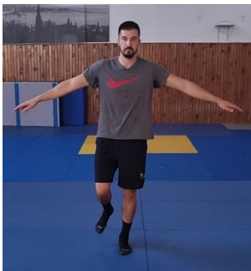
Slika 15. Stajanje na jednoj nozi

Iz sunožnog raskoračnog stava podignuti jednu nogu s poda i održati balans s osloncem na jednu nogu. Ova vježba koristi se na početku proprioceptivnog treninga zbog njenog laganog izvođenja a cilj ima osvijestiti tijelo za održavanje balansa.