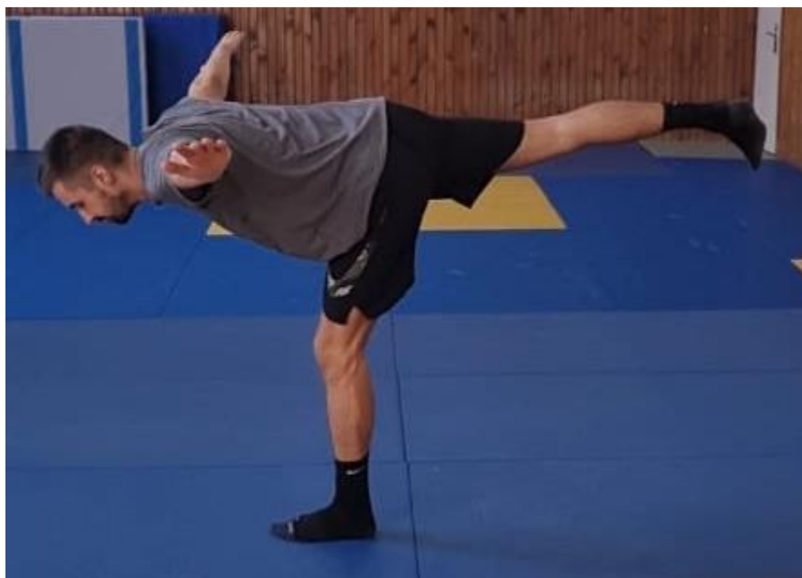
Slika 16. Vaga

Iz sunožnog raskoračnog stava zauzima se položaj vage tako da tijelo ostaje s osloncem na jednoj nozi dok trup ide u pretklon dok druga noga prati kretnju gornjeg dijela tijela