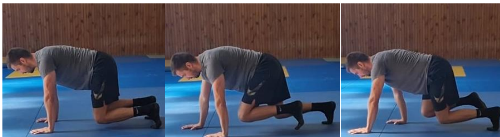
Slika 58. Bird - dog

Iz klečećeg stava s rukama u projekciji ramena sportaš koljena podiže blago od poda te aktivacijom trbušnih mišića radi izdržaj u toj poziciji. Vježba u kretanju se izvodi radeći male korake prema naprijed sinkroniziranim pokretima noge i suprotne ruke. Cilj ove vježbe je aktivirati mišiće cijelog tijela a posebno mišiće trupa.