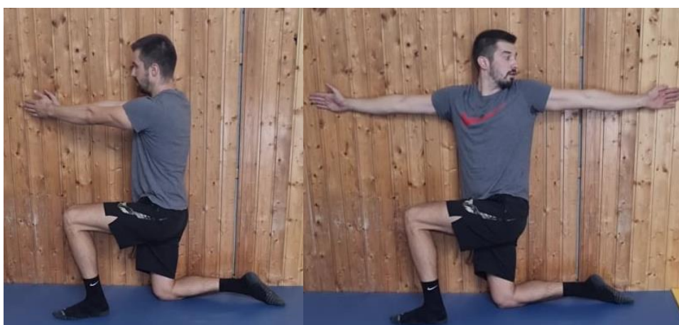
Slika 64. Rotacija trupa i ruke iz klečećeg stava

Iz klečećeg položaja zauzeti položaj iskoraka tako da je noga bliže zidu stražnja noga s koljenom na podu dok je druga noga u prednjem položaju gdje je kut između potkoljenice i natkoljenice 90^\circ . Ruke su opružene u laktu u visini ramena. Radi se rotacija trupom tako da ruka koja je dalje od zida prati kretnju trupa dok ne dođe do potpune rotacije nakon