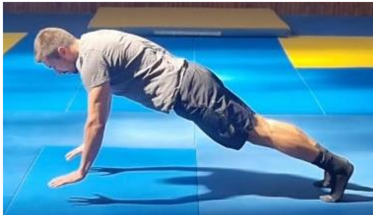
Slika 39. Sklekovi s odrihom

Početna pozicija je upor prednji nakon čega slijedi dolazak u poziciju skleka gdje je kut između podlaktice i nadlaktice 90^\circ , nakon toga se radi opružanje u lakatnom zglobu maksimalnom brzinom tako da se dlanovi odvoje od poda, nakon čega slijedi amortizacija i ponovni dolazak u poziciju upora prednjeg. Cilj ove vježbe je razvoj jakosti i eksplozivne snage prsnih i ramenih mišića. Naprednija verzija ove vježbe bi bila prilikom odraza rukama o pod da se napravi pljesak te amortizacija samog skleka i zauzimanje početne pozicije. Ovu vježbu ponoviti 10 puta.