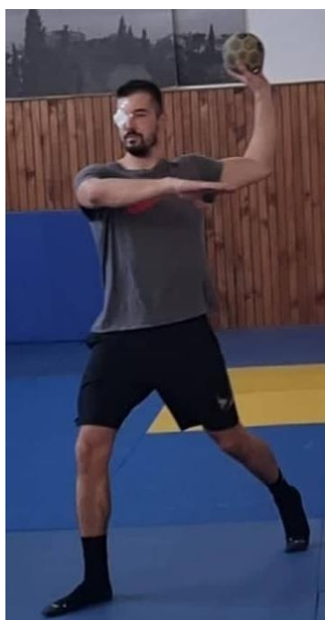
Slika 33. Jednoručno dodavanje uz zaklopljeno oko