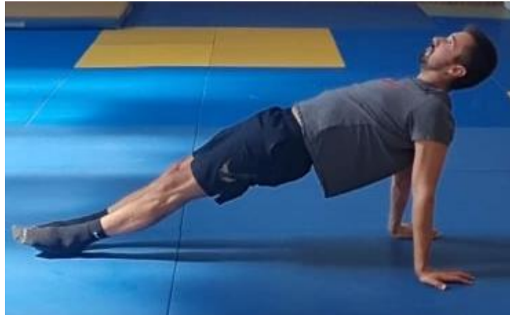
Slika 53. Upor stražnji

Početna pozicija je ležeći stav na leđima. Na znak trenera sportaš radi upor oslanjajući se na dlanove i pete dok je ostatak tijela u ravnini uz aktivaciju mišića nogu i trupa. Greška koja se javlja prilikom izvođenja ove vježbe je da kukovi budu prenisko ili previsoko u odnosu na noge i trup. Ovu vježbu raditi 45 sekundi.