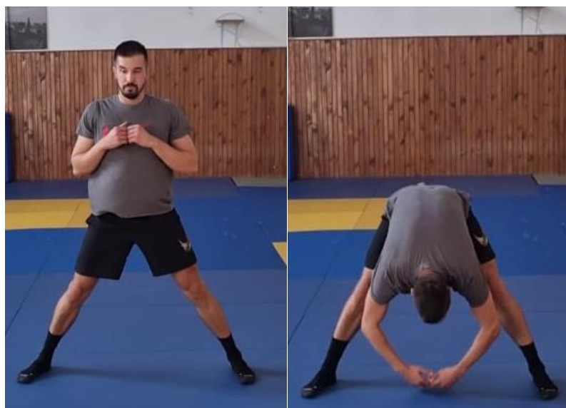
Slika 8. Pretklon u raskoračnom stavu