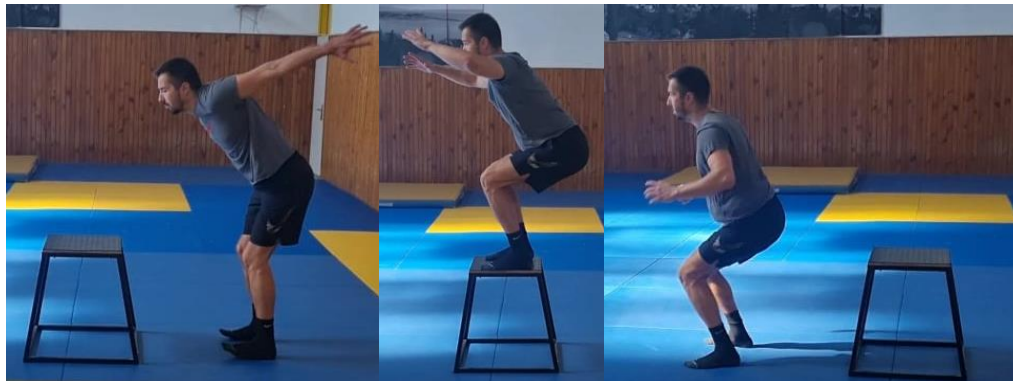
Slika 46. Sunožni skok na klupicu

Iz sunožnog raskoračnog stava izvesti skok na kutiju tako da se igrač spusti u polučučanj te uz upotrebu ruku napravi jaki odraz o podlogu, nakon amortizacije doskoka sunožno saskočiti s kutije. Ovu vježbu poviti 10 puta. Cilj ove vježbe je razvoj eksplozivne snage i jakosti donjih ekstremiteta.