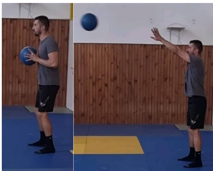
Slika 29. Dodavanje medicinke s dvije ruke

U raskoračnom stavu medicinka se prima s dvije ruke u razini prsnog koša, radi se polučučanj te na znak izbačaj medicinke gurajući je prema naprijed i gore. Ova vježba izvodi se maksimalnom snagom kako bi sportaš razvijao snagu i eksplozivnost što će mu doprinijeti kod šutiranja u rukometu. Ova vježba izvodi se 10 puta.