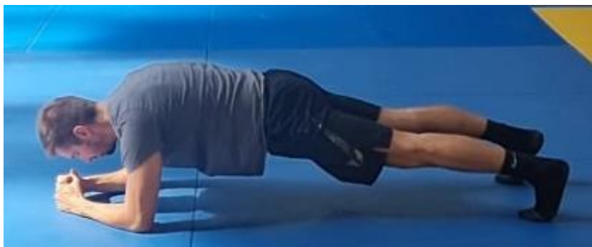
Slika 51. Plank

Iz ležećeg stava na prsima na znak trenera se oslanja na podlaktice i nožne prste te aktivacijom trbušnih mišića i mišića nogu postavlja kukove u visini trupa. Položaj planka zahtijeva aktivaciju cijelog tijela a najviše abdominalnih mišića. Ova vježba se izvodi u trajanju od 1 minute. Cilj ove vježbe je aktivirati trbušne mišiće.