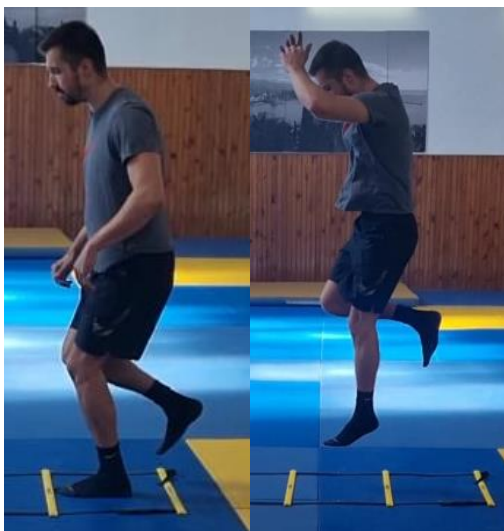
Slika 40. Jednonožni skokovi preko podnih ljestvi

Iz sunožnog stava zauzimanje jednonožnog stava, te skokovi prema naprijed. Rade se eksplozivni skokovi tako da svakim skokom se doskoči u naredno polje i tako do kraj ljestvi. Nakon toga ponoviti sve suprotnom nogom. Ovu vježbu ponoviti 3 puta svaka noga. Cilj ove vježbe je razviti eksplozivnu snagu gležnja te poboljšati koordinaciju manipulirajući svojim tijelom skokovima na jednoj nozi.