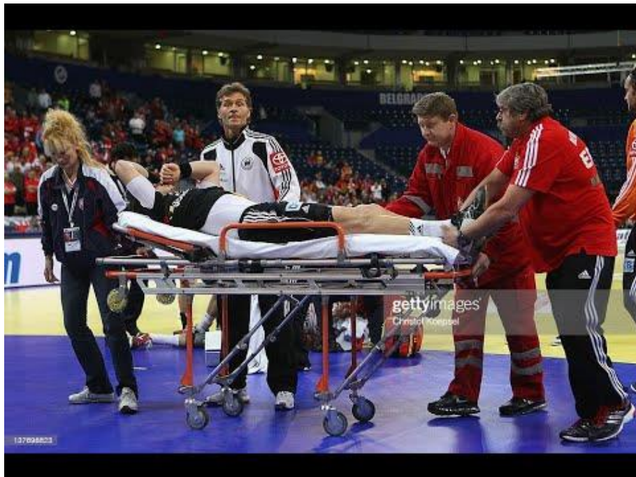
Slika 2. Ozljeda prilikom rukometne utakmice