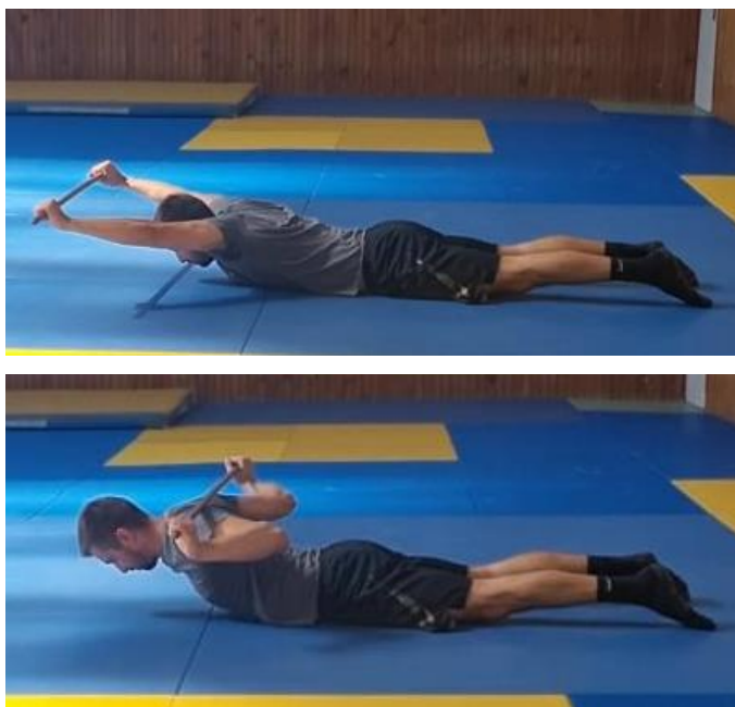
Slika 63. Povlačenje štapa iza glave

Početni položaj je ležeći na prsima s rukama u uzručenju čvrsto primiti štap s obje ruke. Povlačenje štapa iza glave do stražnjeg dijela ramena te povratak u početnu poziciju. Cilj ove vježbe je povećati raspon pokreta stražnjeg dijela ramena. Ovu vježbu ponoviti 10 puta.