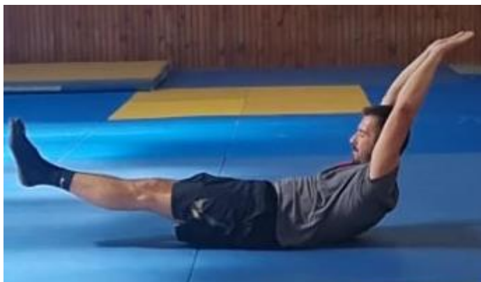
Slika 57. Sklopka izdržaj

Iz početnog ležećeg stava s rukama u uzručenju na znak trenera noge, ruke i trup se odvajaju od poda a oslonac ostaje na m.gluteus. Izometričnom kontrakcijom trbušnih mišića zadržati taj položaj. Ovu vježbu raditi 45 sekundi.