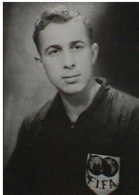
Slika 14. – Bernard Vukas, najbolji igrač u povijesti Hajduka (dostupno na https://hr.wikipedia.org/wiki/Bernard_Vukas )

Stari plac je pučki naziv za nekadašnje igralište nogometnog kluba Hajduk. Prvotno se, prije osnivanja Hajduka, taj komad zemlje zvao Krajeva njiva, koje je služilo kao vježbalište austrougarske vojske. Na Starom placu igralo se od 1911. do 1979., kada je za potrebe 8. mediteranskih igara izgrađen novi moderni stadion na Poljudu.