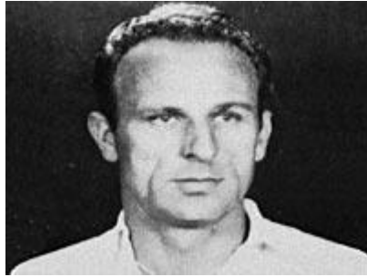
Slika 13. – Frane Matošić, legendarni kapetan Hajduka (dostupno na https://hr.wikipedia.org/wiki/Frane_Matošić )

U Hajduku je ponikao i trofejni hrvatski trener Tomislav Ivić, koji je vodio sjajnu „zlatnu generaciju“ koja je sedamdesetih godina 20. stoljeća četiri puta bila prvak države te osvojila pet kupova.