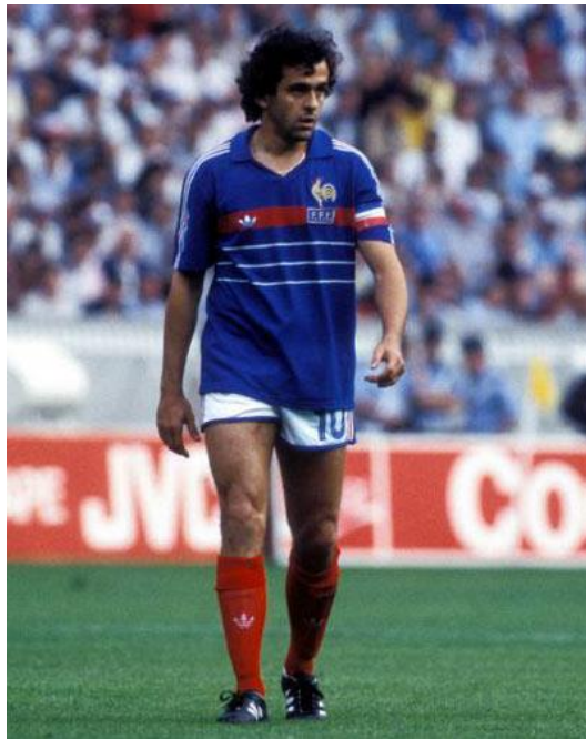
Slika 9. – Michel Platini, čuveni francuski nogometaš

Godine 1976. europski prvak dobiven je izvođenjem jedanaesteraca, u čemu je Čehoslovačka bila bolja od Zapadne Njemačke. Četiri godine kasnije, 1980., došlo je do promjene načina igranja u završnici. U finalni turnir ušli su pobjednici sedam kvalifikacijskih skupina te domaćin Italija. Zapadna Njemačka pobjedom protiv Belgije postala je drugi put europski prvak. Prvenstvo 1984. jedno je od najljepših u povijesti, na njemu su dominirali Francuzi zahvaljujući nogometnom velemajstoru Michelu Platiniju. U finalu u Muenchenu 1988. Nizozemci su pobijedili SSSR 2:0 golovima Gullita i Van Bastena. Danska je 1992. na natjecanje u Švedskoj ušla kao zamjena za suspendiranu Jugoslaviju, ali je na kraju praktički bez priprema postala europski prvak.