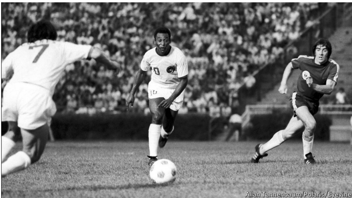
Slika 3. – Pele, brazilski kralj nogometa

Tada se pojavljuje i Pele, po mišljenju mnogih najbolji igrač svijeta svih vremena. Izniman je u svim elementima nogometne igre – tehnici, udarcu, proigravanju, driblingu, pregledu igre te atraktivnim golovima i potezima. Nastupio je na SP 1958., 1962., 1966. i 1970. U karijeri je nastupio na 1362 utakmice te dao 1280 golova.