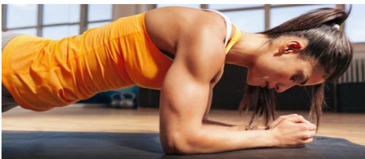
Slika 6. Primjer vježbe izdržljivosti (plank)

Cilj je povećanje otpora na umor i ubrzanje oporavka između poena na treninzima i mečevima. Za aktivnost većinom odabiremo trčanje iako se ponekad u pripremnom periodu mogu koristiti i druge aktivnosti poput biciklergometra, veslanja i plivanja.