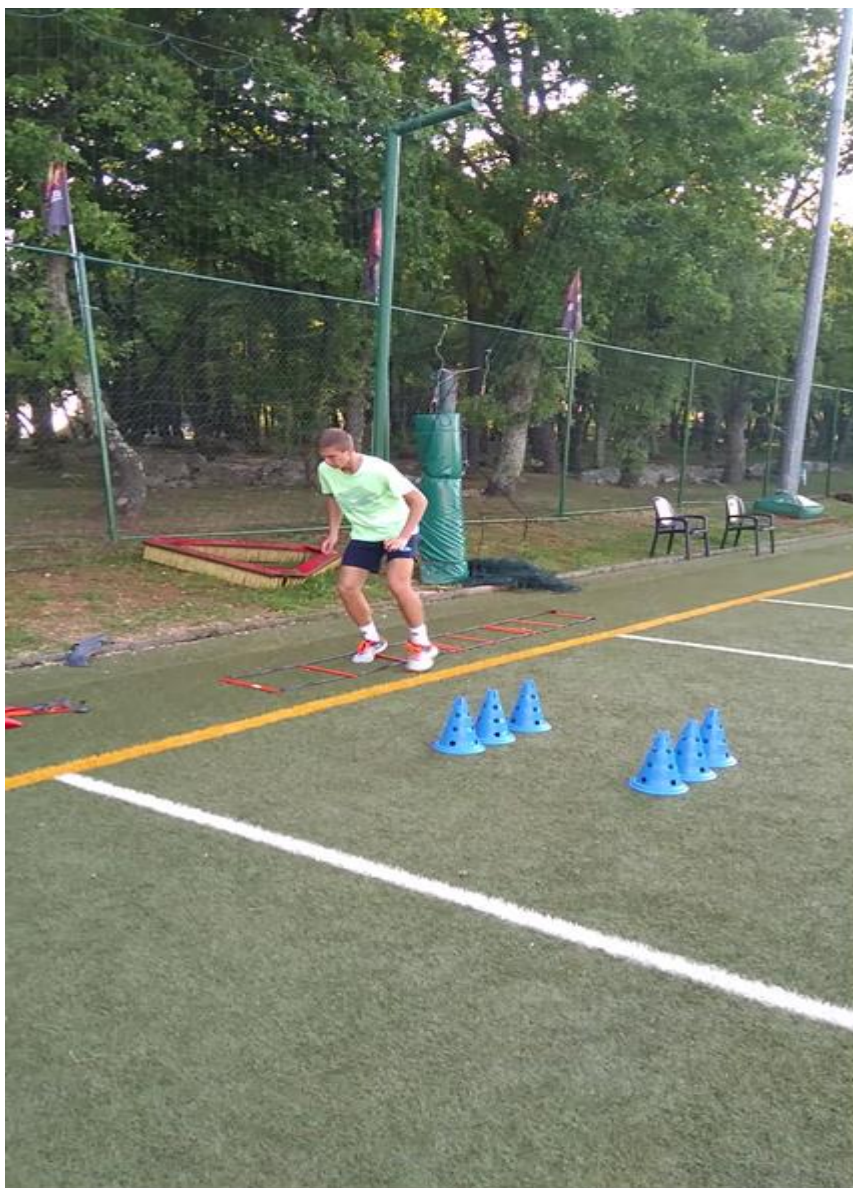
Slika 4. Ljestvice za razvoj agilnosti

Posebnu pozornost razvoju agilnosti treba usmjeriti nakon četrnaeste godine tenisača, i tu treneri mogu uz pomoć nekoliko jednostavnih trenažnih rekvizita (ljestvice-Slika 4., markeri, štapovi i dr.) kreirati bezbroj treninga, što ima za cilj izbjegavanje monotonije i zasićenosti.