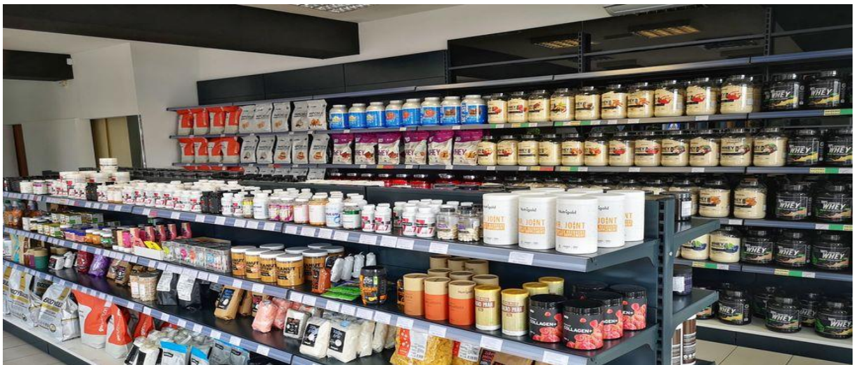
Slika 3. Veliki izbor dodataka prehrani