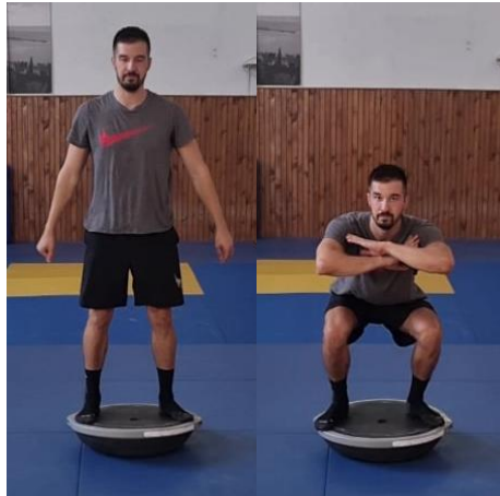
Slika 19. Čučanj na balans ploči

Iz sunožnog stava na balans ploči spuštanje u čučanj s rukama ispred tijela. Cilj ove vježbe je kontrolirati tijelo u izvođenju kompleksne vježbe prilikom izvedbe na nestabilnoj podlozi a i samim tim jačati mišiće donjeg dijela tijela. Varijacija ovog čučnja izvodi se 10 puta. Nestabilna podloga poput balans ploče pruža veći stres na zglobove koljena i gležnje te im omogućuje adekvatnu pripremu za razne doskoke koji očekuju tijelo prilikom rukometne igre.