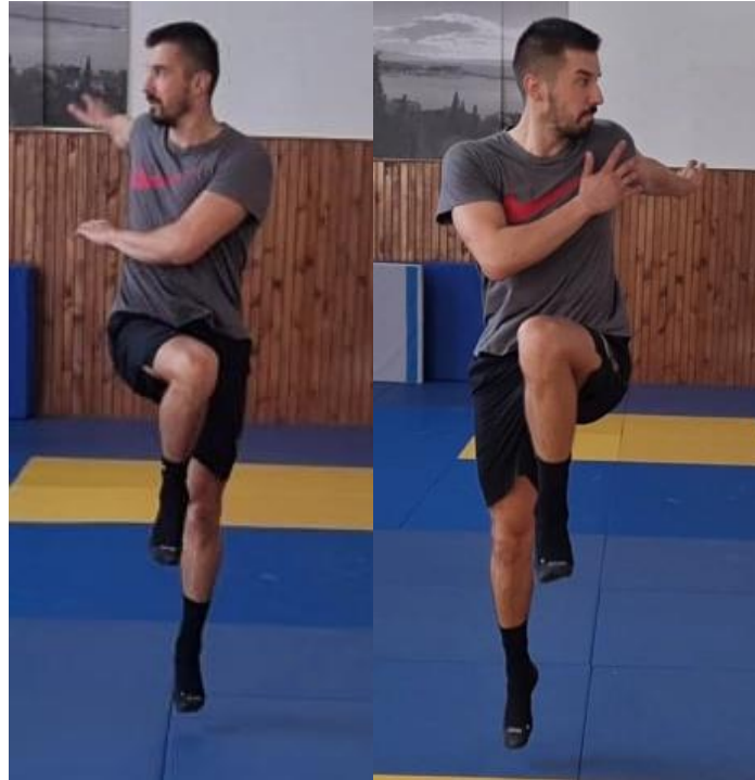
Slika 6. Zasuci rukama u kretanju

Iz trčanje prema naprijed radimo odraz s jednom nogom te istovremeno podižemo drugo koljeno, i radimo zasuk gornjim dijelom tijela na stranu podignute noge tako da nam se ruka nalazi pod kutom od 90^\circ , a glava prati kretanju ruke. Ova vježbu koristimo kako bi zagrijali zglob kuka i torakalni dio kralježnice jer ovaj pokret koristimo kao pripremu za skok šut u rukometnom treningu.