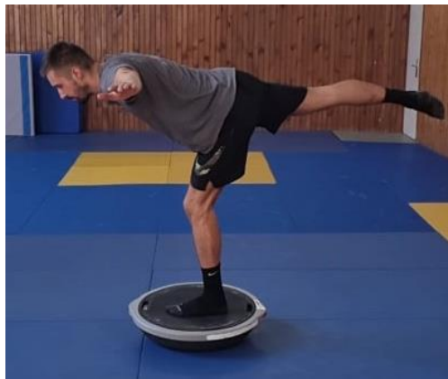
Slika 21. Vaga na balans ploči

Iz sunožnog stava na balans ploči zauzimanje jednonožnog stava te zatim trup ide u pretklon dok noga prati kretnju gornjeg dijela tijela dok trup i noga ne budu paralelni s podlogom. Ruke su u odručenju zbog održavanja balansa. Vježba se ponavlja 10 puta