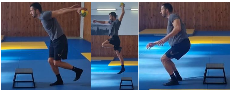
Slika 45. Skok na klupicu i skok šut

Igrač drži loptu u dominantnoj ruci i radi jednonožni odraz na klupicu, nakon amortizacije doskoka izvodi skok šut s klupice te sunožno doskače ispred klupice. Ovu vježbu ponoviti 10 puta. Cilj ove vježbe je spoj rukometnih elemenata s pliometrijskim elementima kako bi igrač što bolje kontrolirao svoje tijelo prilikom skokova i udaraca te raznih doskoka koji za vrijeme rukometne igre nisu u idealnim uvjetima.