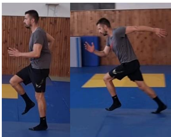
Slika 12. Niski skip + sprint