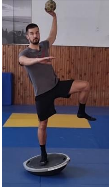
Slika 24. Jednoručno dodavanje s jedne noge na balans ploči

Igrači se nalaze u sunožnom stavu te prilikom dodavanja lopte zauzimaju jednonožni stav te dominantnom rukom dodaju loptu suigraču. Cilj ove vježbe je imitirati standardno dodavanje iz rukometa ali je otežano na način da igrači nemaju stabilnu plohu ispod nogu te moraju kontrolirati svoje tijelo prilikom dodavanja kako bi bili spremni za dodavanja iz raznih pozicija koje ih očekuju za vrijeme utakmice.