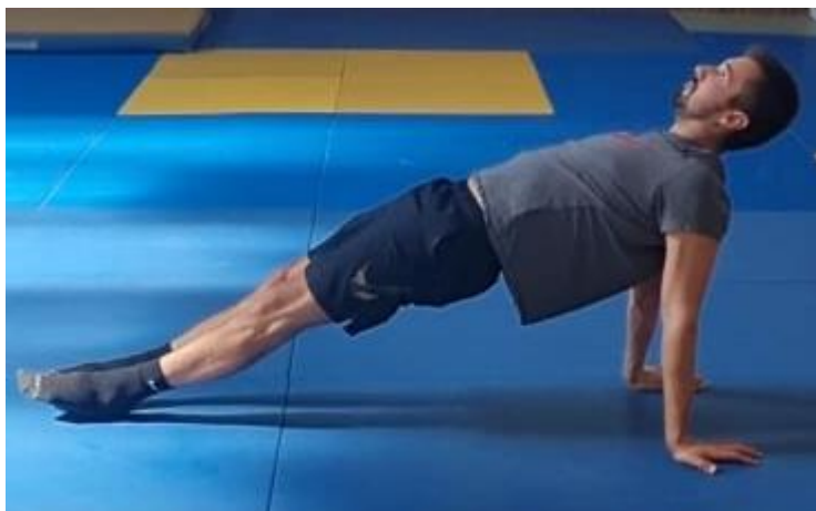
Slika 53. Upor stražnji

Početna pozicija je ležeći stav na leđima. Na znak trenera sportaš radi upor oslanjajući se na dlanove i pete dok je ostatak tijela u ravnini uz aktivaciju mišića nogu i trupa. Greška koja se javlja prilikom izvođenja ove vježbe je da kukovi budu prenisko ili previsoko u odnosu na noge i trup. Ovu vježbu raditi 45 sekundi.