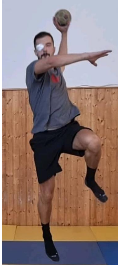
Slika 34. Skok šut uz zaklopljeno jedno oko

Nakon dodavanja u mjestu i kretanju slijedi šutiranje na gol. Igrač iz kretanja prema naprijed radi skok šut te šutira na gol uz zaklopljeno jedno oko. Cilj ove vježbe je da igrač maksimalno osvijesti kontrolu svojim tijelom te snalaženje u prostoru kako bi mogao šutirati jednako efikasno kao i u idealnim uvjetima. Kada igrači savladaju dodavanje i šutiranje uz zatvoreno oko naprednija vježba bi bila simulacija igre 3 na 3 s tim da igrači koji su u napadu imaju zaklopljeno oko dok igrači u obrani nemaju. Cilj te vježbe bi bio maksimalno otežati napadu igru kako bi u utakmici mogli odgovoriti na sve neočekivane situacije koje ih očekuju.