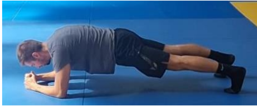
Slika 51. Plank

Iz ležećeg stava na prsima na znak trenera se oslanja na podlaktice i nožne prste te aktivacijom trbušnih mišića i mišića nogu postavlja kukove u visini trupa. Položaj planka zahtijeva aktivaciju cijelog tijela a najviše abdominalnih mišića. Ova vježba se izvodi u trajanju od 1 minute. Cilj ove vježbe je aktivirati trbušne mišiće.