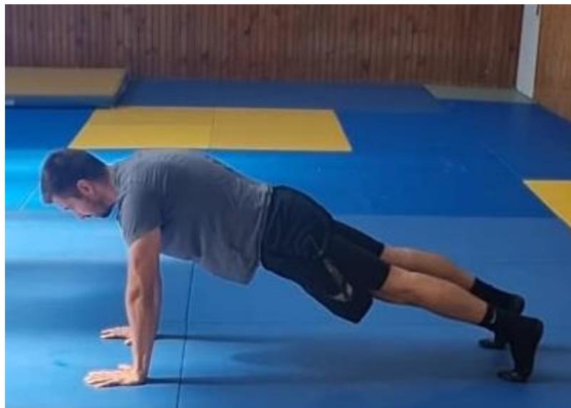
Slika 52. Plank opruženim rukama

Izdržaj u uporu prednjem. Oslonac tijela je na dlanovima i nožnim prstima. Leđa su blago savijena kako bi se dodatno povećala aktivacija trupa. Ovu vježbu raditi 1 minutu.