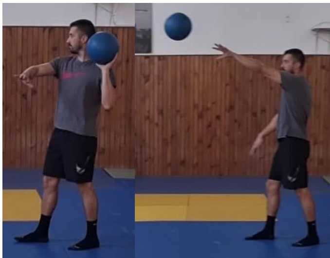
Slika 30. Dodavanje medicinke jednom rukom

Početna pozicija je raskoračni stav, medicinka se nalazi u dvije ruke u visini prsnog koša. Kada je igrač spreman za dodavanje, loptu prima jednom rukom te čini korak naprijed suprotnom nogom a loptu podiže u visinu ramena. Prilikom izbačaja loptu usmjerava