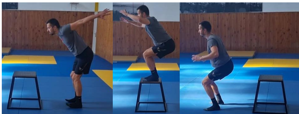
Slika 46. Sunožni skok na klupicu

Iz sunožnog raskoračnog stava izvesti skok na kutiju tako da se igrač spusti u polučučanj te uz upotrebu ruku napravi jaki odraz o podlogu, nakon amortizacije doskoka sunožno saskočiti s kutije. Ovu vježbu poviti 10 puta. Cilj ove vježbe je razvoj eksplozivne snage i jakosti donjih ekstremiteta.