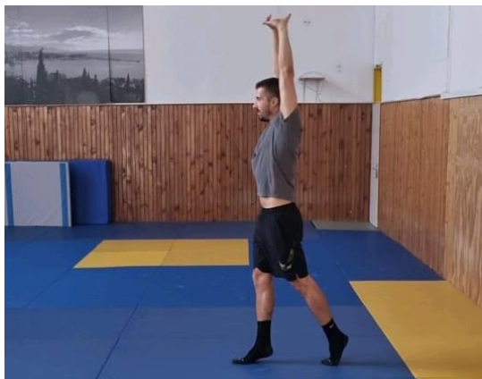
Slika 3. Hodanje na prstima, ruke u uzručenju

Početna pozicija je raskoračni stav, zatim se podižemo na nožne prste, a ruke postavljamo u položaj uzručenja te u tom položaju hodamo do suprotne strane igrališta zatim se okrećemo i nastavljamo s radom do uzdužne crte s koje smo krenuli. U ovoj vježbi primarno aktiviramo m.gastrocnemius.