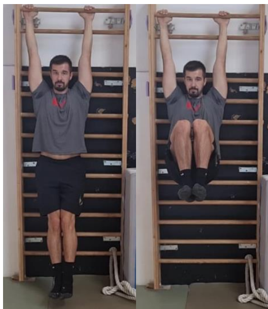
Slika 59. Podizanje nogu

Iz visa na švedskim ljestvama privlačenje natkoljenice prema prsima radeći fleksiju u zglobu kuka, te kontrolirano spuštanje u početnu poziciju. Teža varijanta ove vježbe bi bilo podizanje nogu opruženih u koljenu ili izdržaj s nogama podignutim pod kutom od 90^\circ u odnosu na trup. Cilj ove vježbe je razvoj trbušnih mišića. Vježbu ponoviti 15 puta.