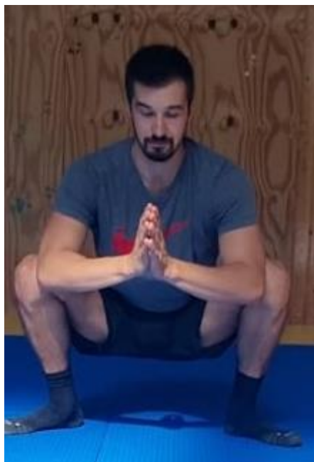
Slika 67. Duboki čučanj

Iz raskoračnog stava zauzimanje pozicije dubokog čučnja te laktovima guranje koljena prema van kako napravili što veću kretnju u zglobu kuka. Zadržati poziciju čučnja 30 sekundi. Cilj ove vježbe je poboljšati mobilnost zgloba kuka i gležnja.