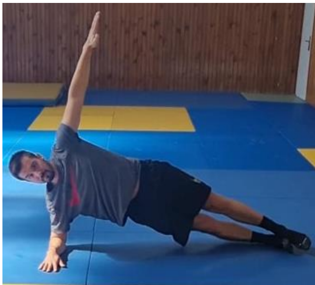
Slika 54. Bočni plank

Sportaš se nalazi ležeći na boku te na znak trenera oslanja se na jednu podlakticu te na vanjski dio stopala. Kukovi podignuti od poda i prate ravnu liniju tijela. Druga ruka je u abdukciji te tijelu osigurava balans. Teža varijanta bi bila pri abdukciji gornje noge te bi to zahtijevalo veću stabilnost tijela i jaču aktivaciju mišića trupa i nogu. ovu vježbu raditi 45 sekundi s svake strane. Cilj ove vježbe je povećati stabilnost trupa i tijela a posebno staviti akcenat na bočne trbušne mišiće.