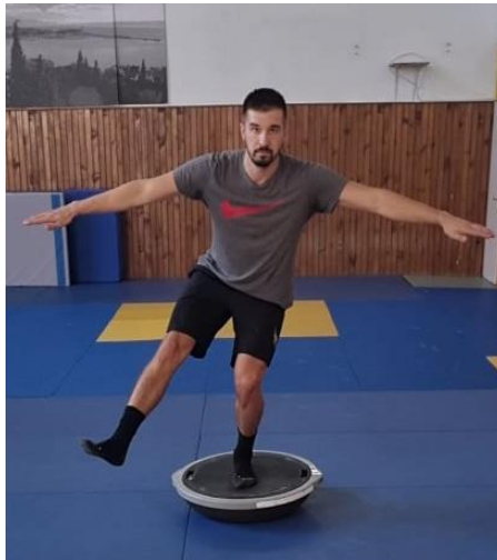
Slika 20. Jednonožni stav na balans ploči

Iz sunožnog stava zauzimanje jednonožnog stava na balans ploči te zatim spuštanje u polučučanj. Cilj ove vježbe je osposobiti tijelo za kontrolu i jakost mišića nogu ukoliko samo jedna noga preuzima teret ostatka tijela. Laganija izvedba ove vježbe bila bi zauzimanje jednonožnog stava bez polučučnja, dok naprednija vježba je spuštanje u duboki jednonožni čučanj. Ova vježba izvodi se 10 puta jedna noga, zatim promjena nogu i ponoviti 10 puta.