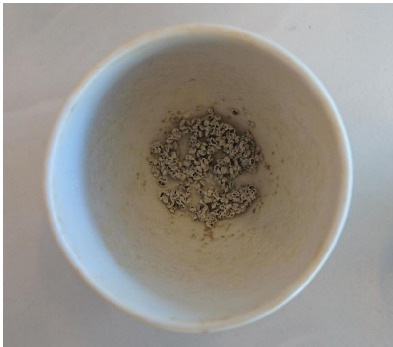
Slika 2.7. Uzorak štitaste ognjice nakon žarenja

Uzorci se spaljuju preko noći na temperaturi od 500 °C. Nakon što se izvade iz peći (slike 2.7. i 2.8.) i ohlade, uzorke je potrebno otopiti u 5 mL 20 % HCl. Ukoliko je potrebno, otopina se zagrije kako bi se sav ostatak otopio.