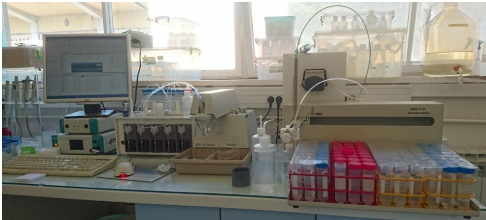
Slika 2.4. \mu Autolab III potencijostat (Metrohm-Autolab)