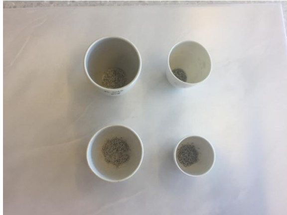
Slika 2.5. Pripremljeni uzorci

Od sjemenki odabranih biljaka (štitasta ognjica i rukola) uzme se po 1 g uzorka i premjesti u lončiče za žarenje (slika 2.5.) i prenese u peć za žarenje (slika 2.6.).