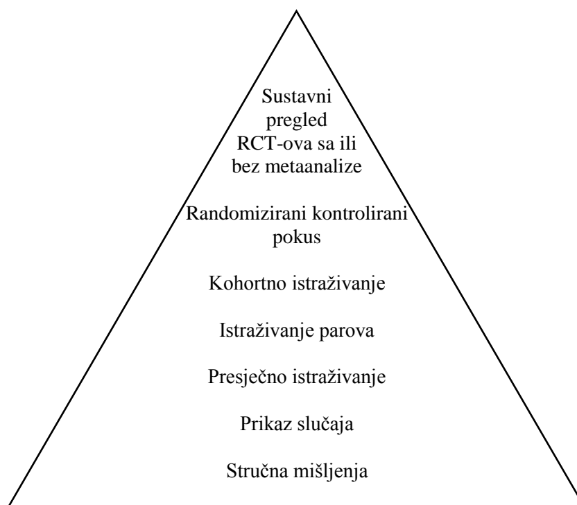
Slika 2. Hijerarhija dokaza u medicini

Postoje i drugi sustavi za procjenu kvalitete znanstvenih dokaza kao što je Centar za medicinu utemeljenu na dokazima iz Oxforda (engl. Oxford Centre for Evidence-Based Medicine ,