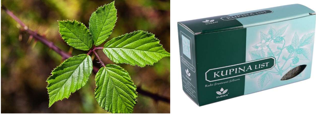
Slika 4. a) List kupine; b) Čaj od lista kupine

Zaboravljeni listovi bobičastog voća dobivaju sve širu primjenu te se mogu promatrati kao izvori vrijednih bioaktivnih spojeva čija svojstva utječu na zdravlje i prevenciju bolesti. (29)