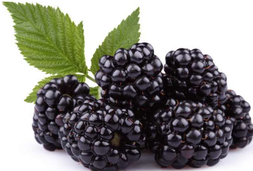
Slika 1. Plod kupine (2)

Biljka cvjeta krajem proljeća i početkom ljeta. Cvjetovi imaju više prašnika. Nakon opadanja latica, voće razvija zbirne plodove koji su u ranoj fazi zelene boje dok kasnije tijekom zrenja prelaze preko crvene u crnu boju. Boja ovisi o prirodnim pigmentima koji su prisutni u kupini te o čimbenicima kao što su sorta, agronomska praksa korištena pri uzgoju, klimatski uvjeti, enzimska aktivnost i mikrobiološka kontaminacija. List kupine je s gornje strane tamno-zelen dok je donja strana svjetlija. (1)