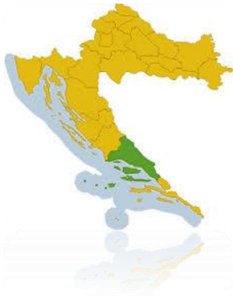
Slika 1. Republika Hrvatska sa Splitsko-dalmatinskom županijom

Podatci o ispitanicima su prikupljeni analizom pismohrane Odjela za sudsku medicinu KBC-a Split. Nakon prikupljanja podatci o ispitanicima su razvrstani prema navedenim varijablama. Tako razvrstani podatci su uneseni u Microsoft Office Excel program za Windows gdje su pripremljeni za daljnju statističku obradu.