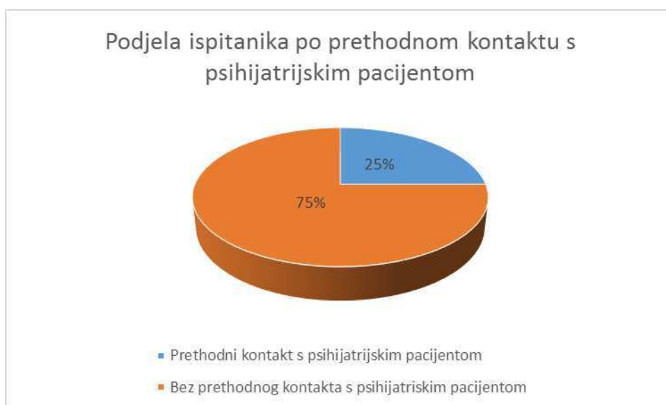
Slika 4. Prikaz ispitanika po prethodnom kontaktu s psihijatrijskim pacijentom

Među ispitanicama je bilo 75% onih koji nisu bili u prethodnom kontaktu s psihijatrijskim pacijentom i 25% koji su bili u kontaktu s psihijatrijskim pacijentom prije nastave iz psihijatrije (Slika 4).