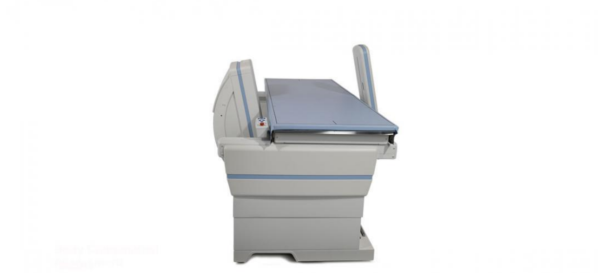
Slika 1. Uređaj za mjerenje mineralne gustoće kosti dvoenergetskom apsorpciometrijom.

kralježnice, kuka i vrata bedrene kosti, a moguće je mjerenje i u području podlaktice, petne kosti i cijelog tijela (18).