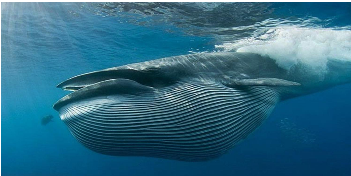
Slika 3. Tropski kit ( Balaenoptera edeni ).

Studija u kojoj se promatralo ponašanje prilikom hranjenja i veličina grupa kod tropskog kita ( Balaenoptera edeni ) i kita perajara ( B. physalus ) sugerira da je kompeticija za hranu razlog zbog kojeg Mysticeti ne formiraju stabilne grupe (Tershy, 1992). Pritom tropski kitovi češće žive solitarno od kitova perajara (Slika 3). Jedan od rijetkih primjera formiranja grupa kod Mysticeta je grupiranje srodno vezanih sivih kitova prilikom migracija iz područja razmnožavanja. Razlog tome je smrtna opasnost koju kitovi ubojice predstavljaju za novorođenu mladunčad koja migrira sa ženkama (Goley i Straley, 1994). Dakle, ako adultne jedinke procjene da će imati koristi udružiti će se sa srodnim jedinkama prilikom migracija. Navedeni primjer pretpostavlja da je kompeticija za hranu manje važna za vrijeme migracija (Swartz, 1986a).