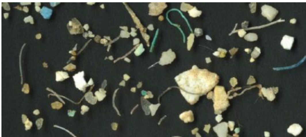
Slika 2. Mikroplastika iz mora.