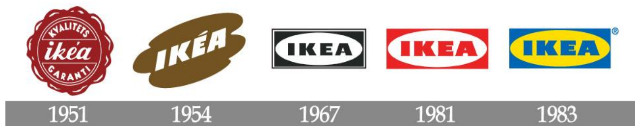
Slika 5. IKEA logotip tijekom povijesti